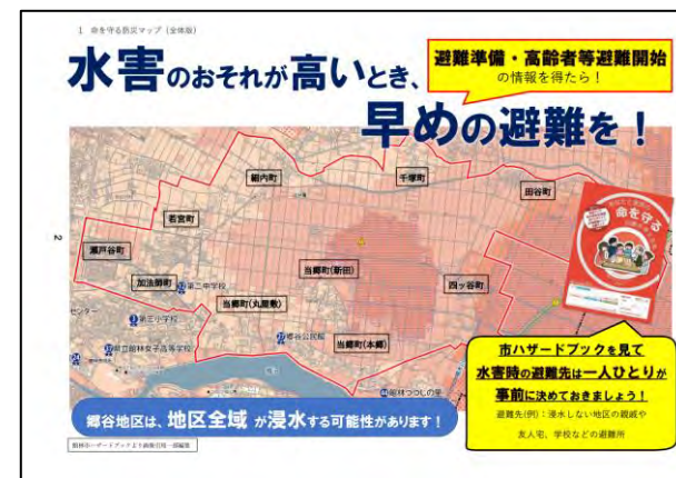
ハザードマップによる浸水域の確認