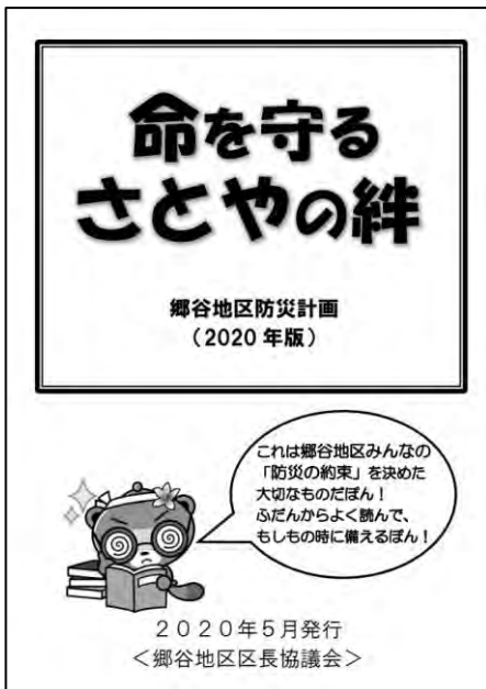
地区防災計画の事例