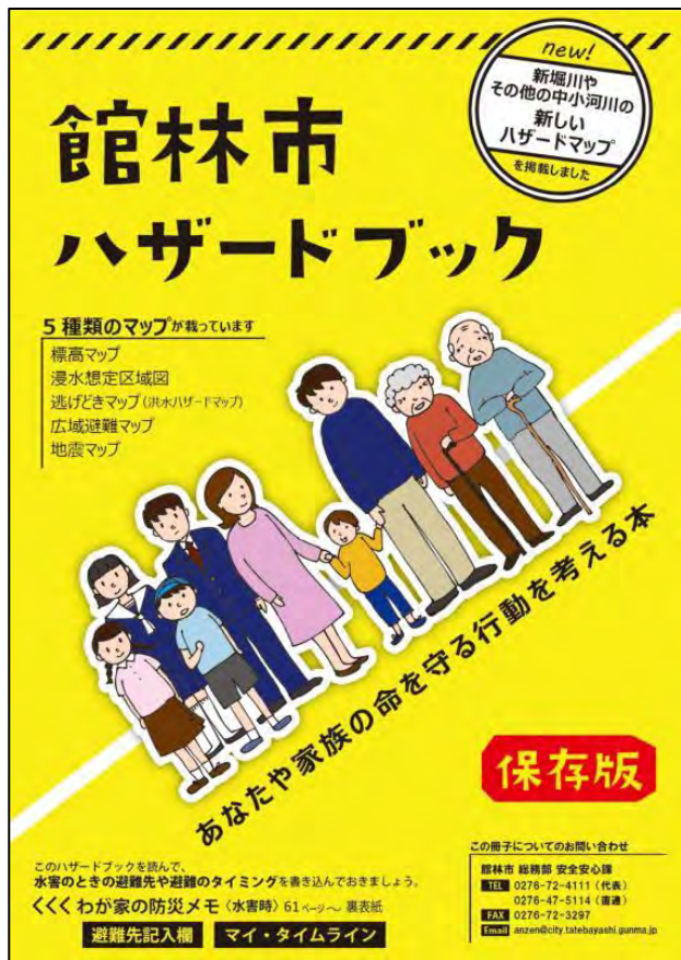
館林市ハザードブック