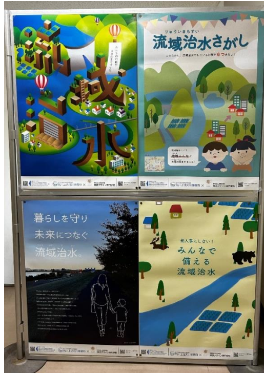
荒川調節池工事事務所