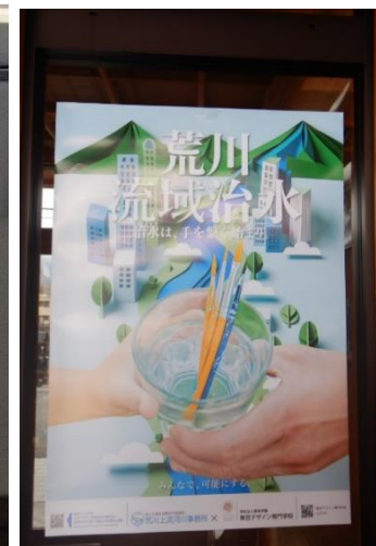
埼玉森林管理事務所