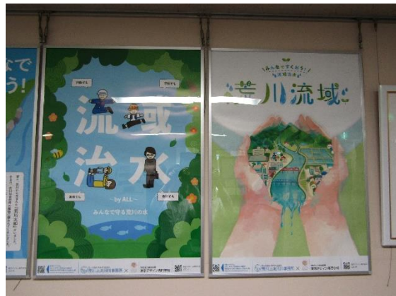
荒川上流河川事務所