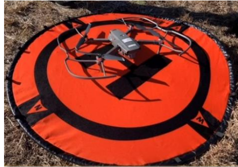
UAVチーム活動の様子