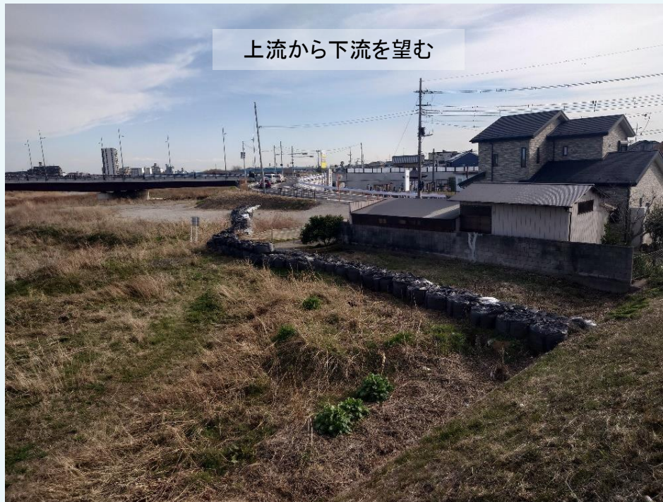
工事着手前(令和6年3月)