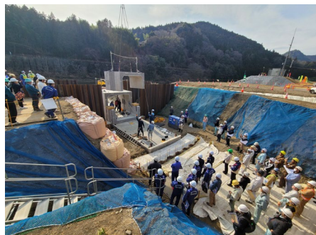
▲現場見学会の様子

令和6年2月15日(木)に、茨城県県北地域の建設会社向けにプレキャスト樋管の施工状況見学会を開催し、約40人が参加しました。プロジェクトで施工する樋管は、工期短縮や現場作業の省力化を目的に、樋管本体に工場製作の二次製品(プレキャスト)を採用しています。プレキャストによる樋管施工は、比較的新しい取り組みであるため、実際の施工状況を確認することにより、施工上の留意点やメリット等を学びました。