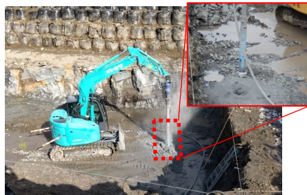
▲ダウンザホールハンマ工法による掘削状況

硬い地盤を掘削する際に有効な工法で、バックホウの先端にピストン内装のハンマーを装着し、高圧力の空気によりハンマーをピストン運動させることで硬い岩盤を打ち砕いて掘削する工法です。効率的に硬い岩盤を掘削することで、今回の現場では約2週間の工期短縮を実現しました。