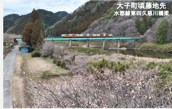
大子町頃藤地先 水郡線第四久慈川橋梁

○寒さが少しずつ和らぎ、大子町頃藤地先では梅の開花を確認しました。お出かけの際は是非お立ち寄りください。 ○久慈川で稼働中の工事のうち10件は令和6年度も引き続き工事を継続します。プロジェクトへのご理解とご協力をよろしくお願いいたします。