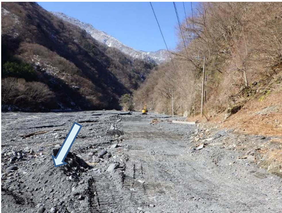
下流側より工事用道路復旧箇所を望む