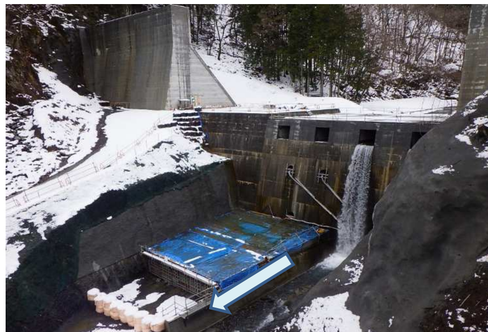
左岸下流側より望む