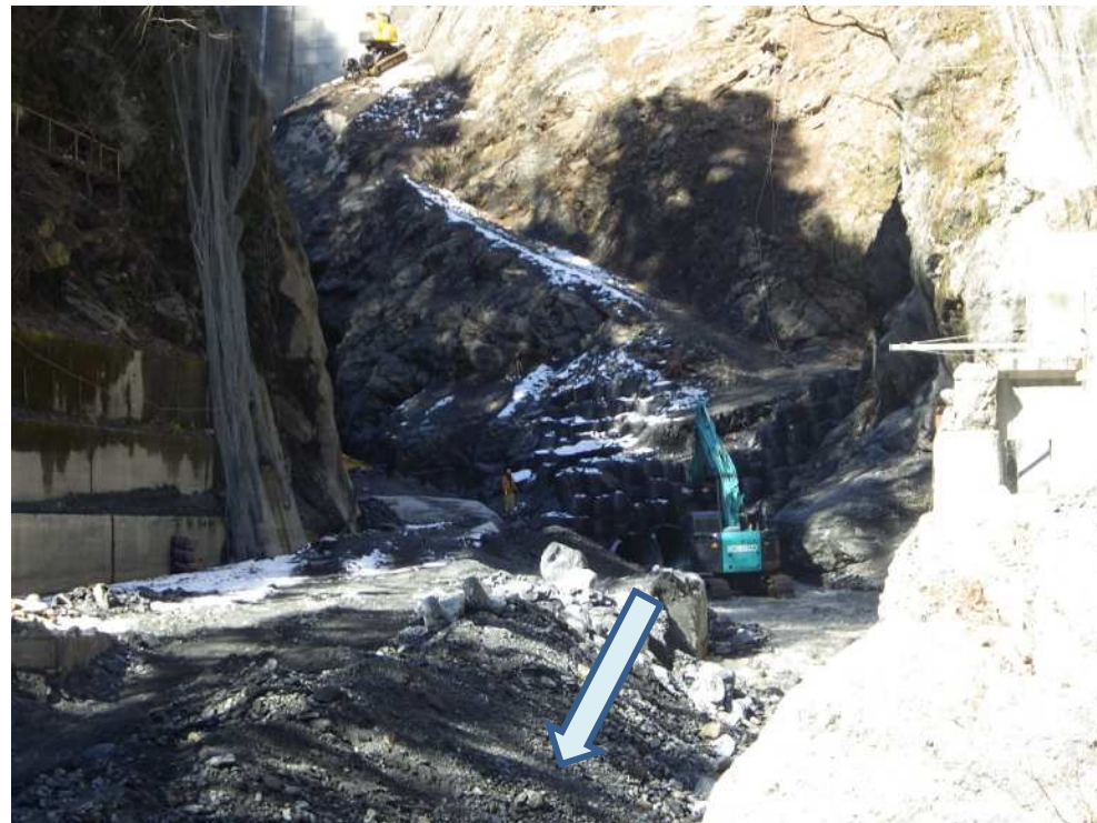
下流側より工事用道路復旧箇所を望む

稲又第三砂防堰堤の改築工事を行うための仮排水路を造る工事です。 現在、流失した工事用道路復旧作業中。