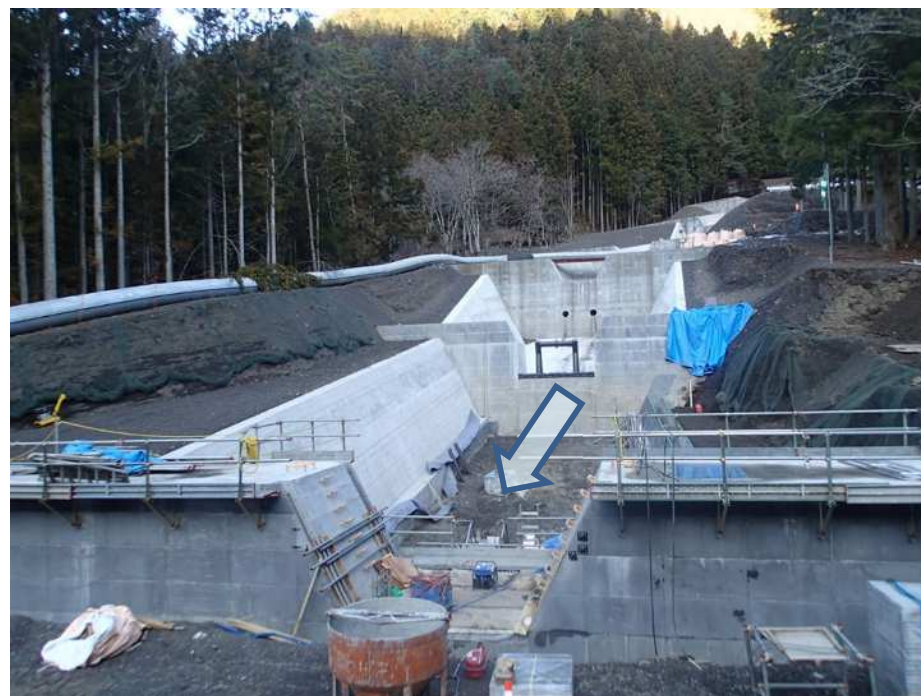
下流側より施工箇所を望む

本工事は、早川左支塩島沢において、土砂災害防止を目的とした砂防堰堤を施工する工事です。 現在、側壁工施工中。