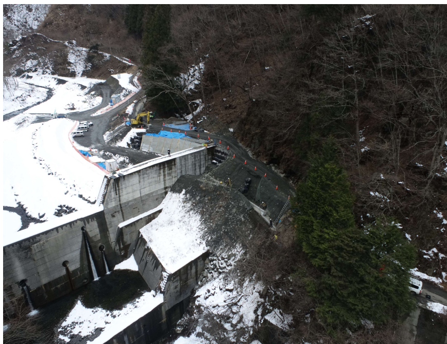
【下流側上空より施工箇所を望む】