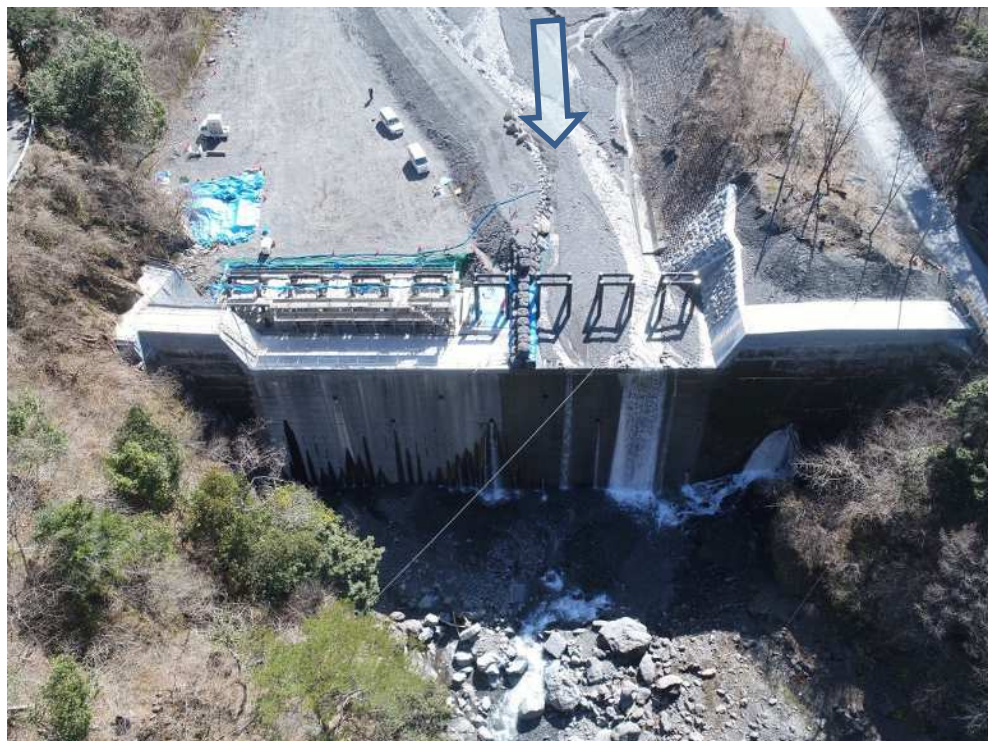
仲島工区 下流側上空より望む