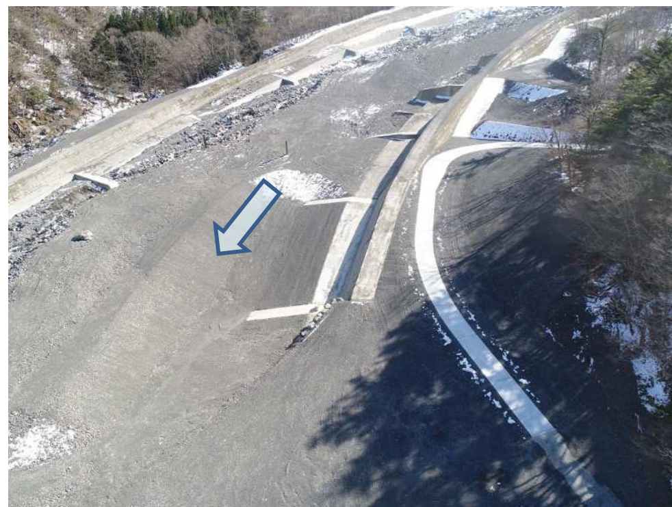
大春木工区 下流側上空より望む

本工事は、早川右支の春木川筋に設置されている既設の仲島砂防堰堤について、流木災害を防止するために、流木捕捉工を設置する工事 及び早川右支川の春木川筋における既設の大春木床固群について、流路機能を維持向上させるため、改築を実施する工事です。現在、仲島工区は堰堤右岸側施工中。大春木工区は管理用道路が完了しました。