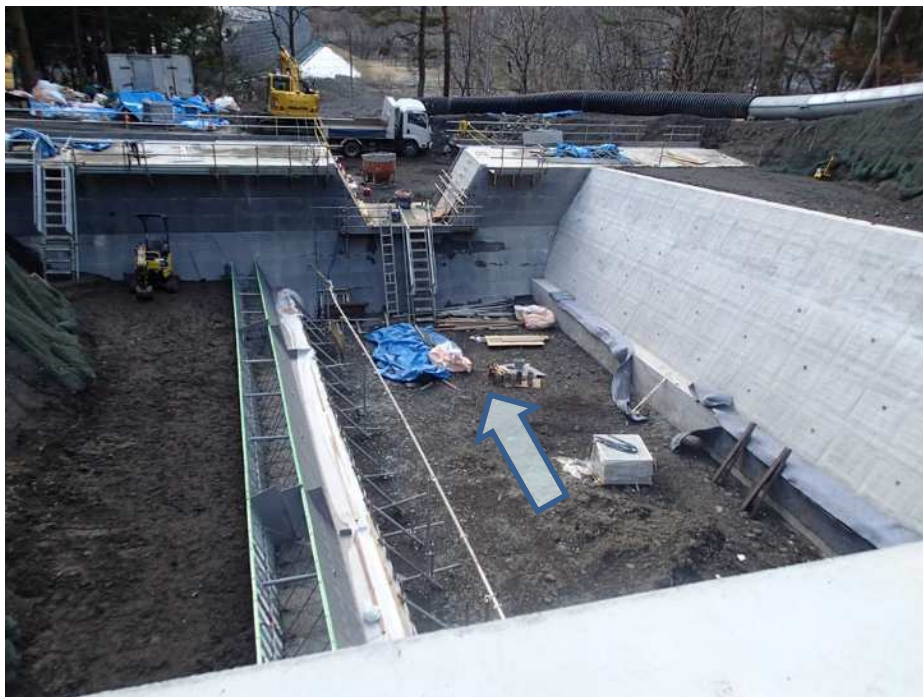
上流側より施工箇所を望む