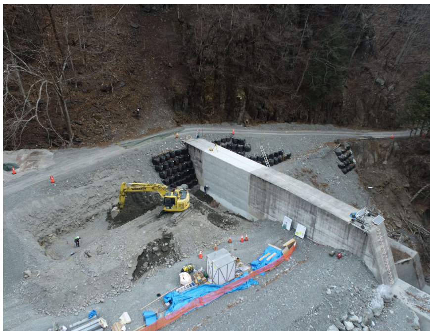
【上流側上空より施工箇所を望む】