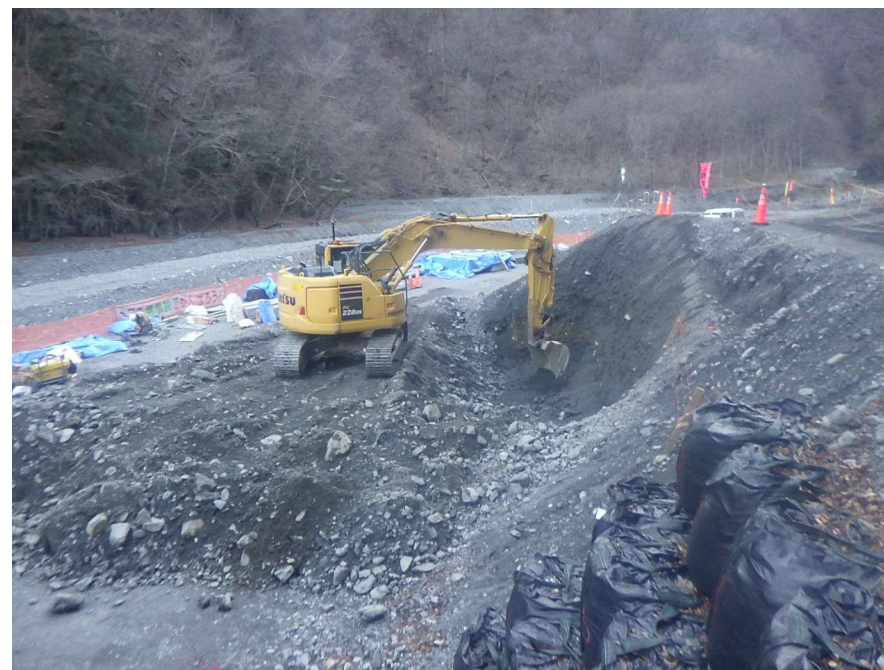
【擁壁設置箇所 掘削状況】

継続中であった砂防堰堤の整備と、上流域の砂防堰堤を整備するための工事用道路を設置する工事を行っています。