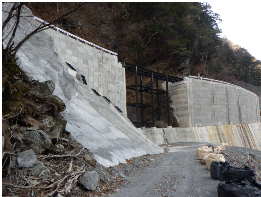
【終点側より施工箇所を望む】