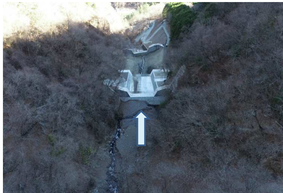
上流側上空より望む

池の沢砂防堰堤群のうち最上流の砂防堰堤で、土砂・洪水を安全に流下させ土砂災害を防止する工事を行っていました。