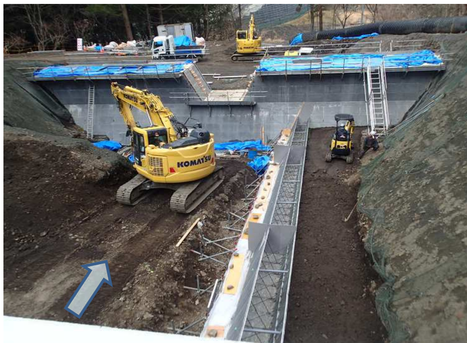
上流側より施工箇所を望む