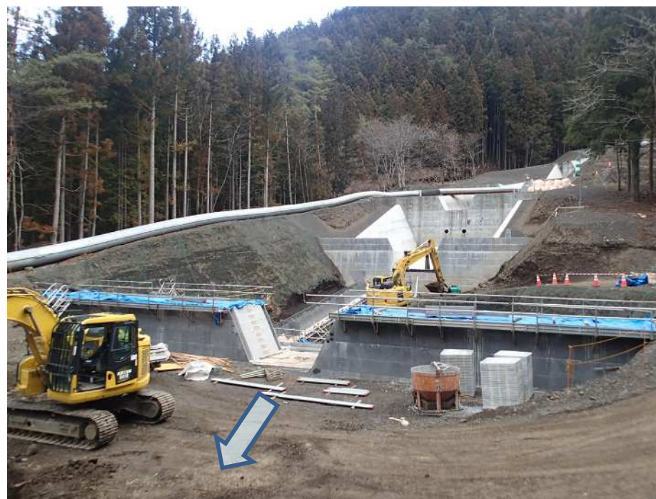
下流側より施工箇所を望む

本工事は、早川左支塩島沢において、土砂災害防止を目的とした砂防堰堤を施工する工事です。 現在、側壁工施工中。