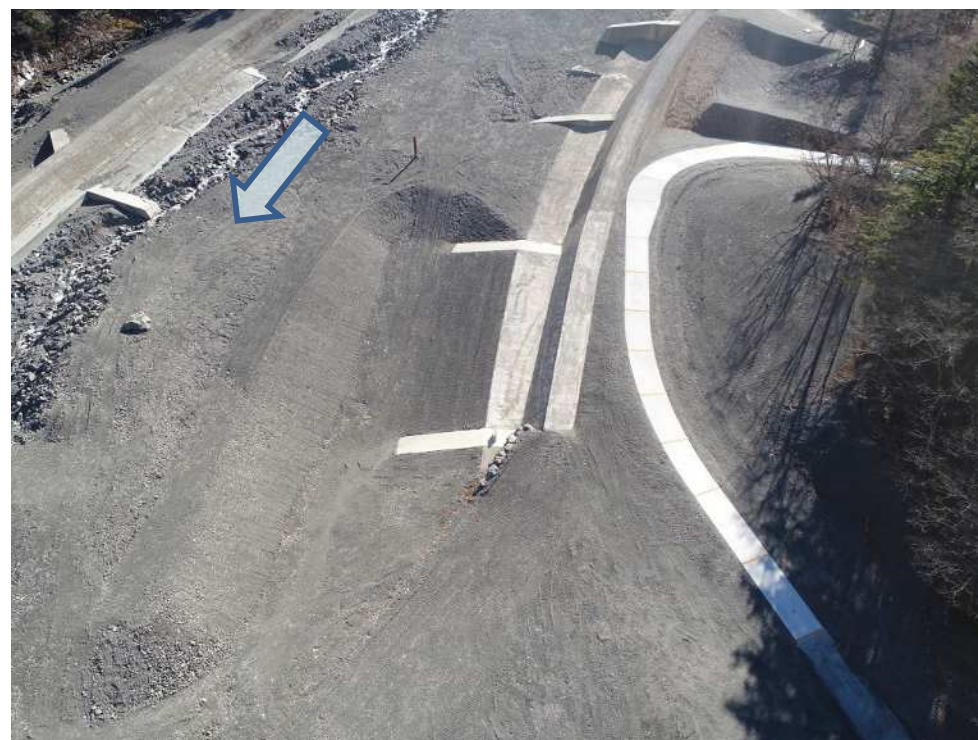
大春木工区 下流側上空より望む

本工事は、早川右支の春木川筋に設置されている既設の仲島砂防堰堤について、流木災害を防止するために、流木捕捉工を設置する工事 及び早川右支川の春木川筋における既設の大春木床固群について、流路機能を維持向上させるため、改築を実施する工事です。現在、仲島工区は堰堤右岸側施工中。大春木工区は管理用道路が完了しました。