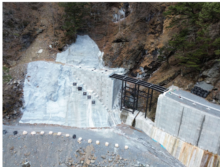
【右岸側上空より施工箇所を望む】

早川右支荒川に、砂防堰堤を整備するための工事用道路を設置する工事を行っています。 全ての工事が無事に完成しました。