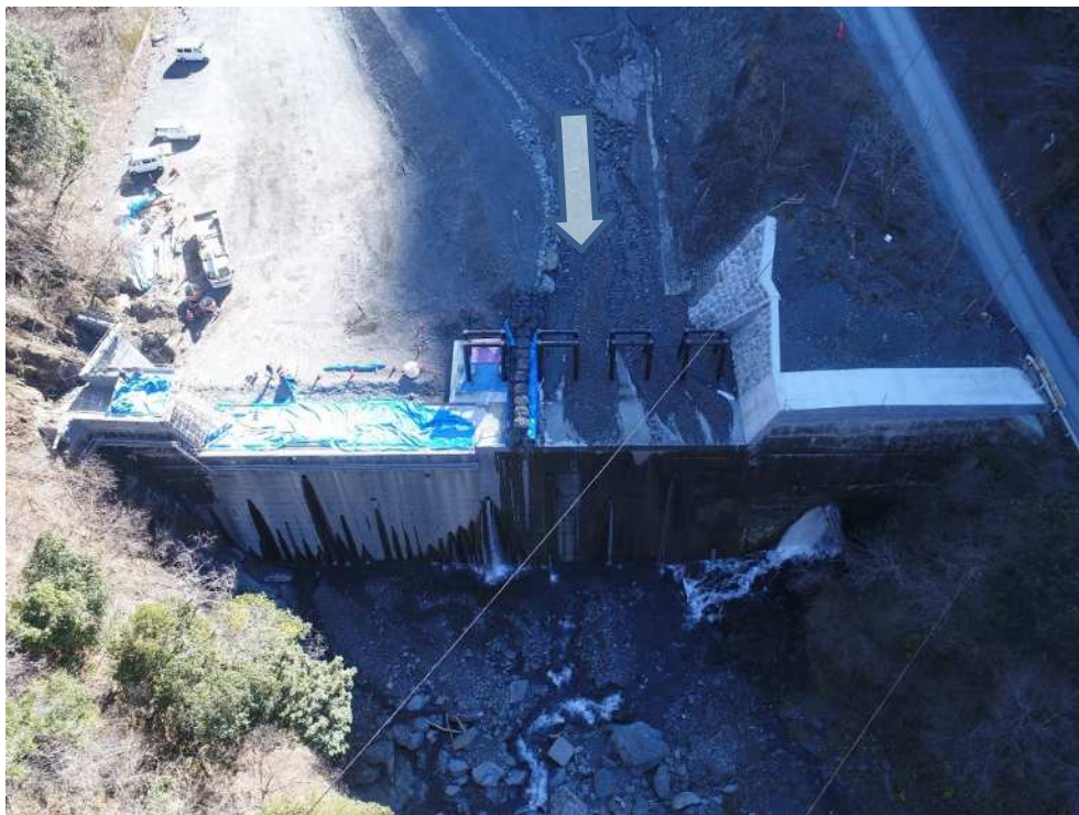
仲島工区 下流側上空より望む