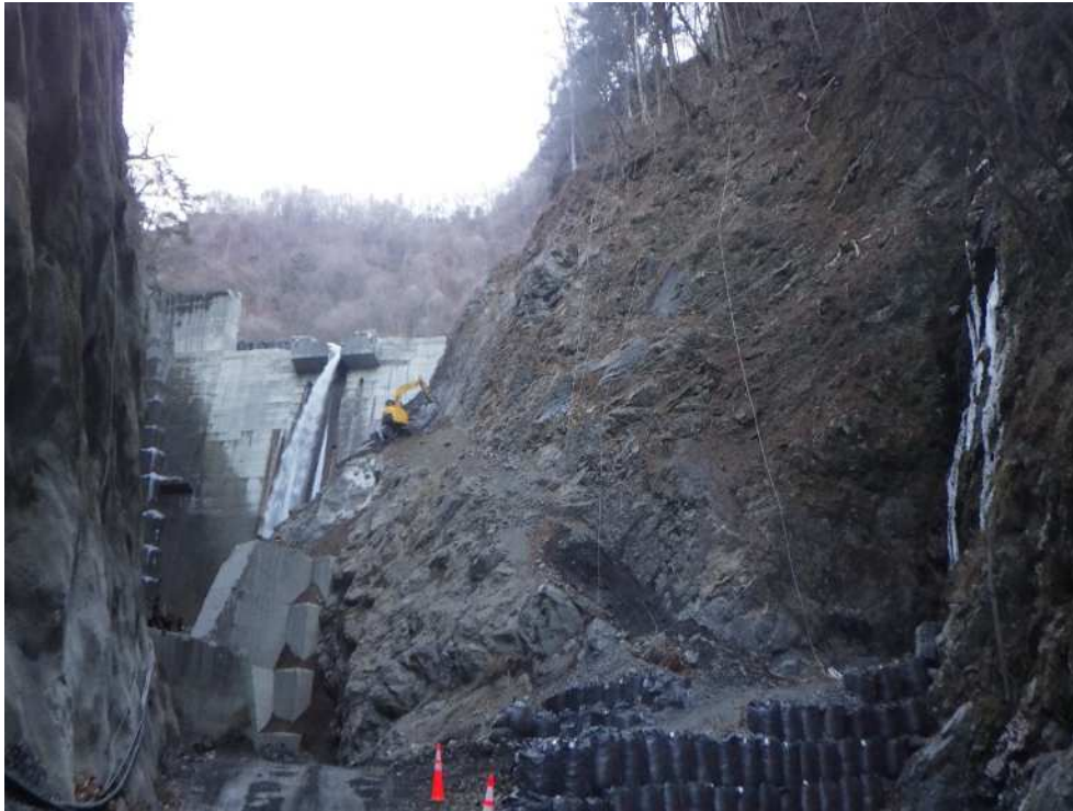
起点側より施工箇所を望む