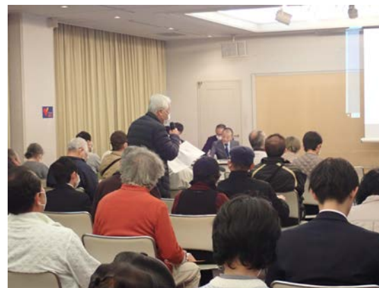
▲ 出席者からの質問の状況

事業概要、道路設計の考え方、事業の流れ等を説明する動画を上映し、その後、図面を閲覧していただき、たくさんのご質問やご意見をいただきました。