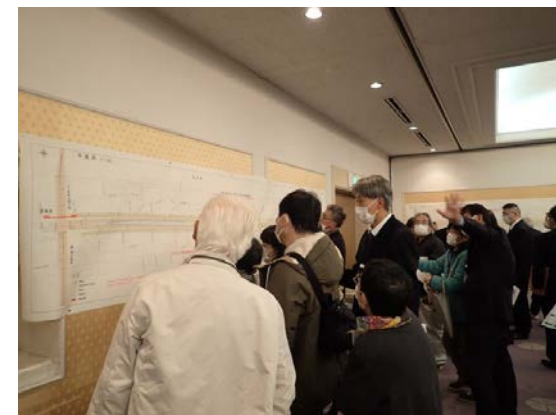
▲ 図面閲覧時の状況