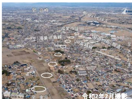
① 田間宮地区から箕田交差点方面を望む