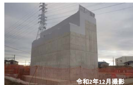
令和2年12月撮影 橋台の完成写真