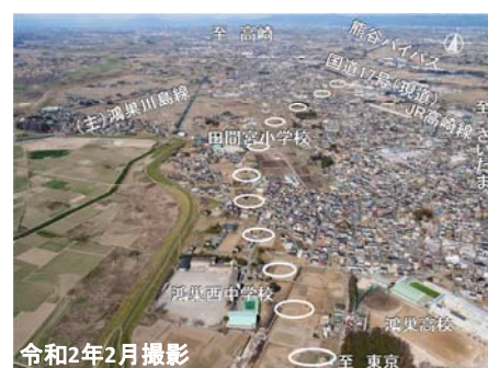
② 大間地区から田間宮地区方面を望む