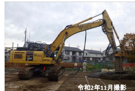
令和2年11月撮影 固い地盤を造る（地盤改良）工事の状況