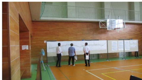
上尾道路設計図面（1/1,000）の説明状況 （田間宮生涯学習センター）

今回、感染対策として一堂に会しての説明会に代り、事前予約制による少人数の参加とし、一方通行（ウォークスルー）方式のオープンハウス型の説明会として参加者同士の「密」を防止して実施しました。