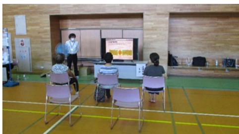
設計説明等の動画閲覧状況 （田間宮生涯学習センター）