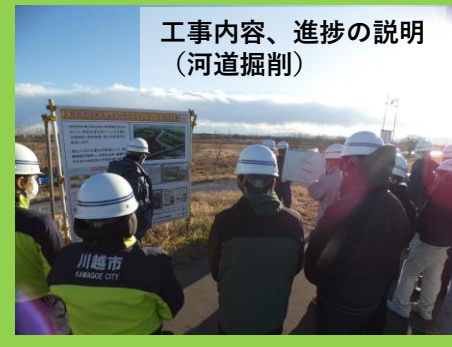
工事内容、進捗の説明 (河道掘削)