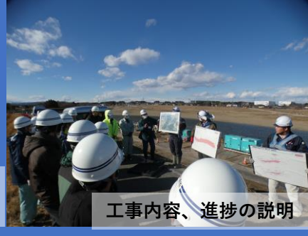
工事内容、進捗の説明