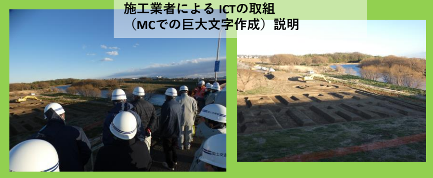
施工業者による ICTの取組 (MCでの巨大文字作成) 説明