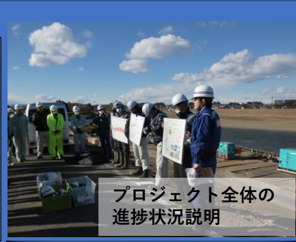
プロジェクト全体の進捗状況説明