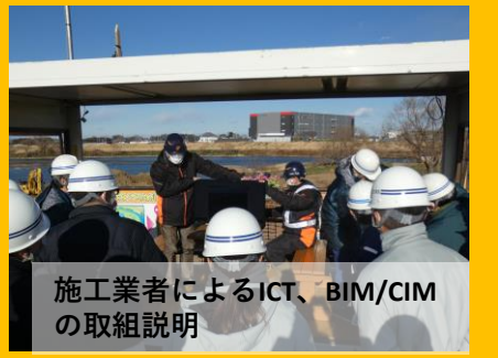
施工業者によるICT、BIM/CIMの取組説明