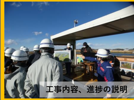
工事内容、進捗の説明