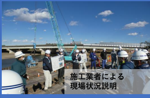
施工業者による現場状況説明