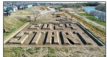
ICT技術による掘削文字出現