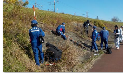
堤防点検状況（桜川）