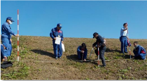
堤防点検状況（那珂川）