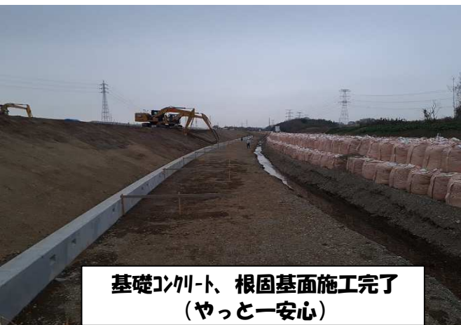
基礎コンクリート、根固基面施工完了 (やっと一安心)