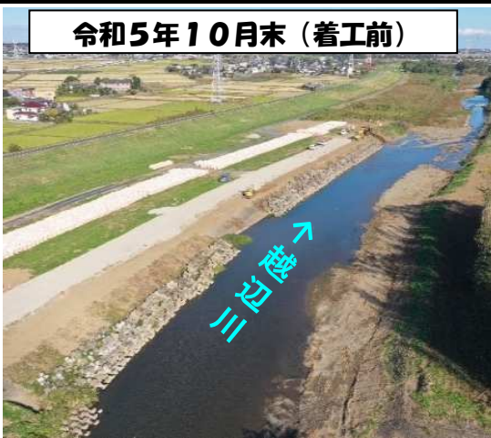
令和5年10月末(着工前)