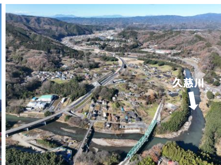
▲袋田バイパス付近の空撮