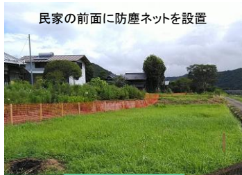
民家の前面に防塵ネットを設置

温泉施設やみその利用者や隣接している民家への配慮が必要 →周辺生活環境に配慮した安全対策及び粉塵対策