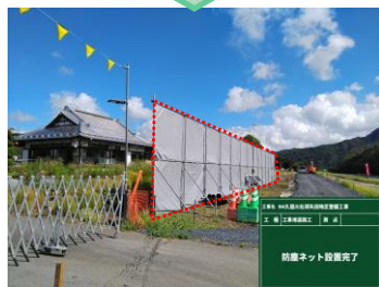
防塵ネット設置完了