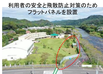
利用者の安全と飛散防止対策のためフラットパネルを設置