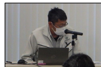
梅澤監理技術者 （川村建設（株））