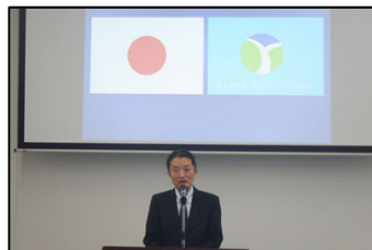
事務所長（あいさつ）