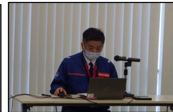
工務第一課長 （R5重点的安全対策等）