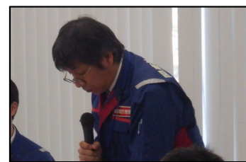
総括保全対策官（右側） （司会、規約改正）