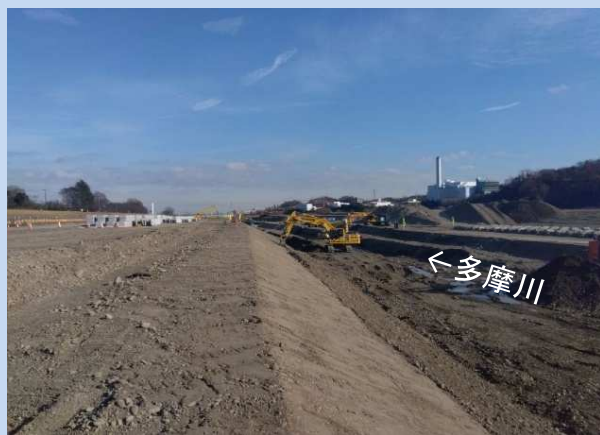
護岸設置のための準備をしています。 (令和5年12月)