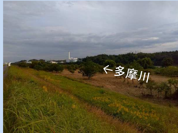
工事に入るため除草をしています。 (令和5年10月)