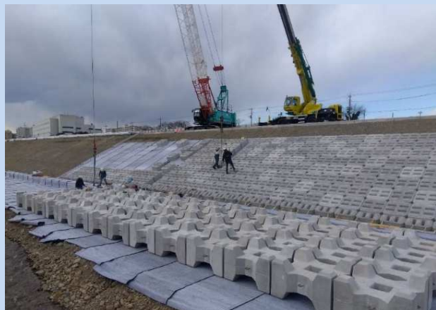
護岸ブロック、根固めブロックを設置しています。 (令和6年1月)