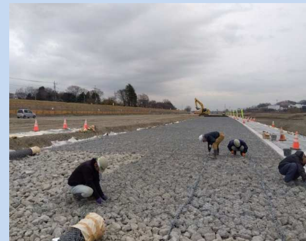
かごマットを設置しています。 (令和6年2月)