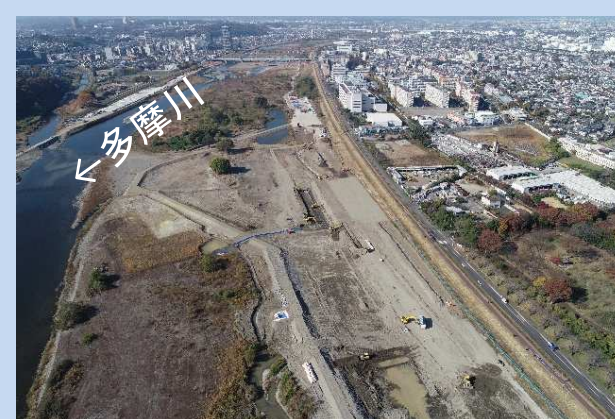
既設護岸の撤去をしています。 (令和5年11月)