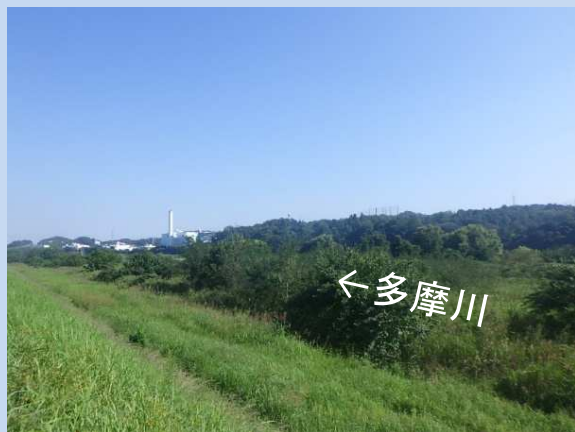
工事着手前 (令和5年9月)