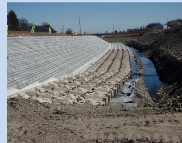
護岸ブロック・根固めブロックを 設置しています。 (令和6年2月)