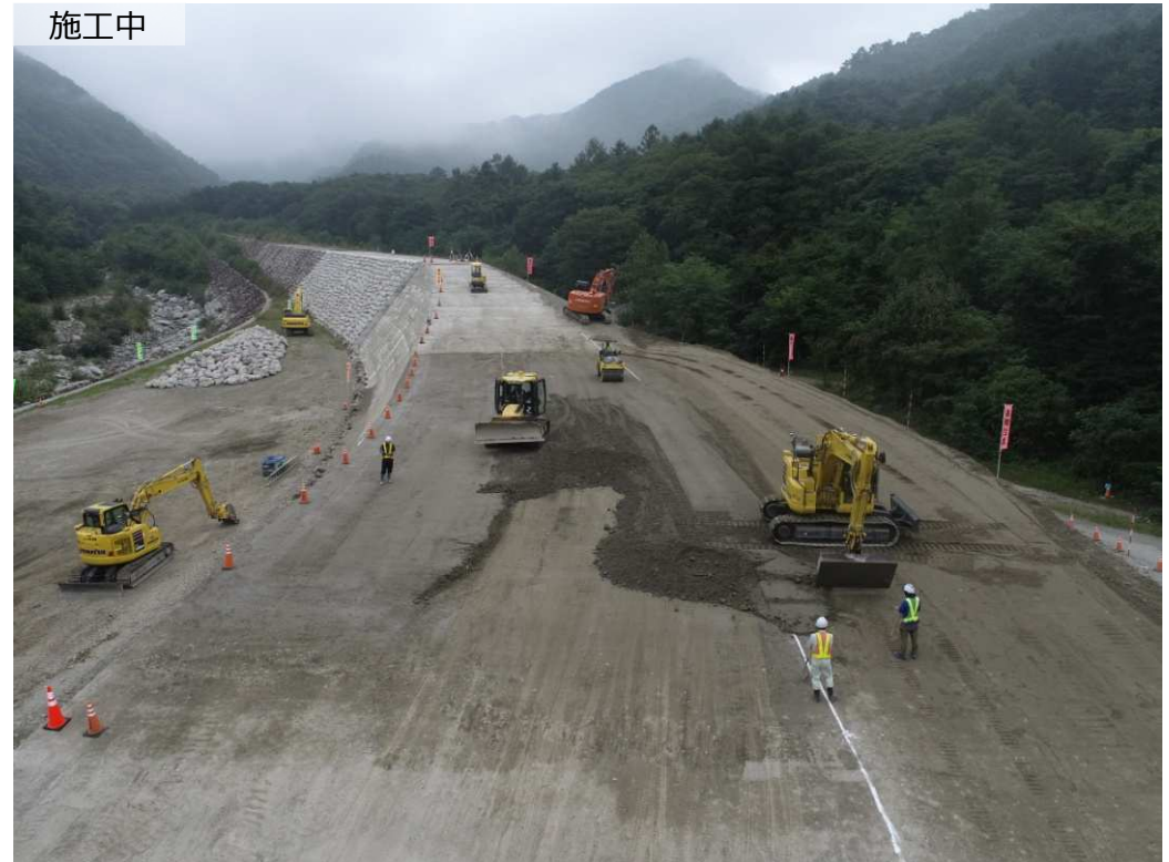
築堤盛土（砂防ソイルセメント部、土砂部）

小武川中流部において、土砂災害を防ぐため、砂防堰堤の一部となる導流堤を設置する工事を行っています。