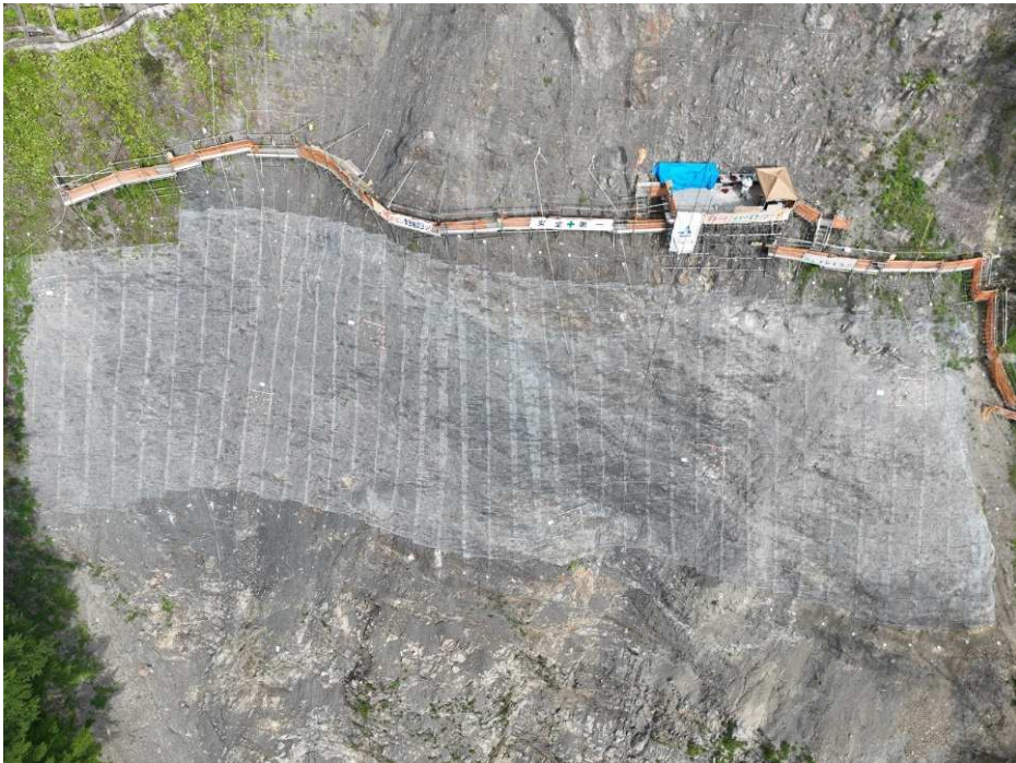
上空より施工箇所を望む