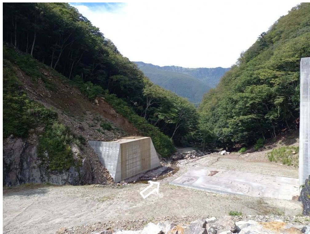
上流 右岸より本堰堤を望む (現場未着手：写真は昨年度までの施工状況)

釜無川右支黒川において、土砂流出に伴う下流域での土砂・洪水氾濫の被害を防止・軽減するため、砂防堰堤を施工する工事。現在、工事用道路斜面崩落箇所への復旧に向け準備中。