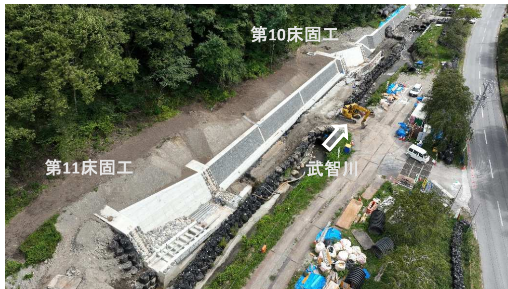
右岸上流より施工箇所を望む（左岸側完了）

武智川下流床固群のうち、床固工、帯工及び護岸を施工し、土砂・洪水を安全に流下させ、土砂災害を防止する工事。現在、左岸側の施工が完了し、右岸側の施工のための仮設工を実施中。