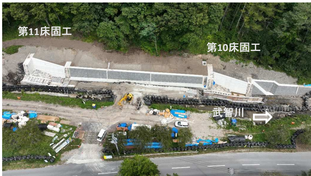
右岸上空より施工箇所を望む（左岸側完了）