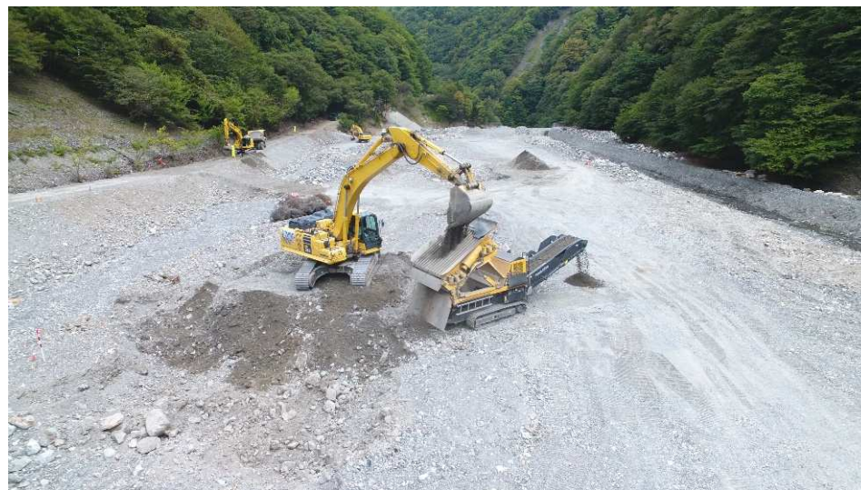
工事用道路 盛土材採取状況 （釜無川砂防堰堤上流）

令和元年10月の台風による出水で被災した釜無川工事用道路の補修等及び中ノ川工事用道路において、コンクリート舗装工を実施する工事。現在、工事用道路（河床路）を実施中。