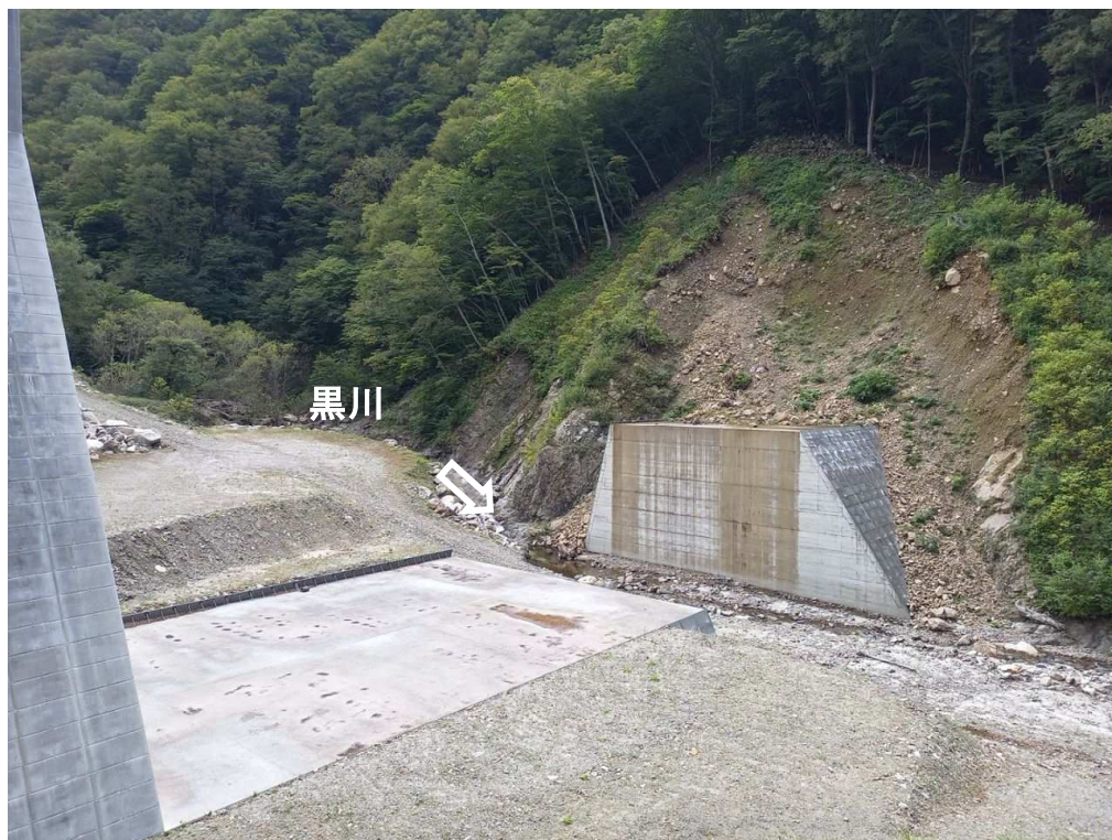
下流 右岸より本堰堤を望む (現場未着手：写真は昨年度までの施工状況)