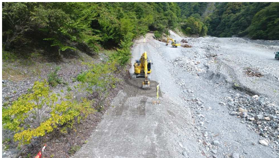
工事用道路（河床路） 施工状況 （釜無砂防堰堤上流）