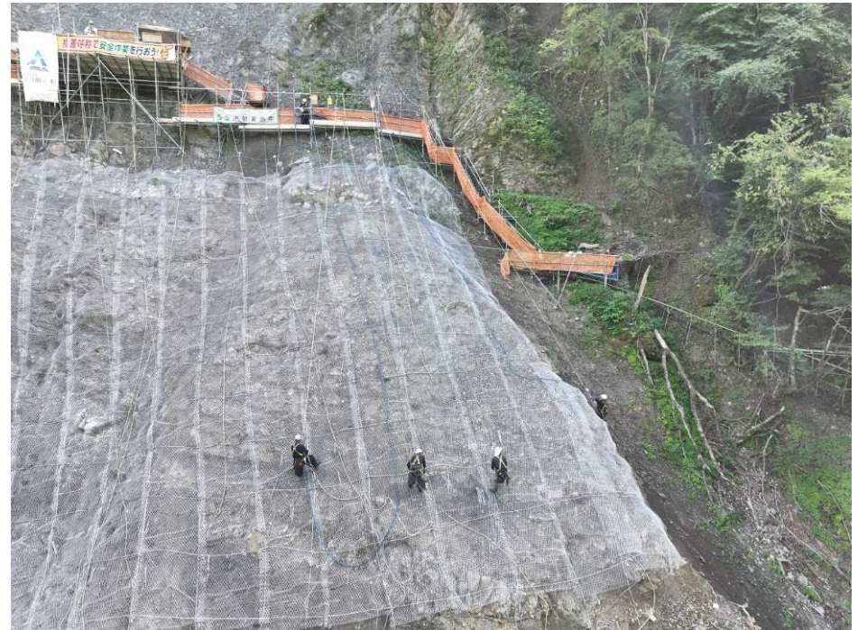
落石防止網工 施工状況

中島砂防堰堤の改築にあたり、支障となる右岸崩壊地からの落石対策を行う斜面对策工事。前年度工事から継続。現在、落石防止網工の施工が完了し、仮設等の撤去に向け準備中。