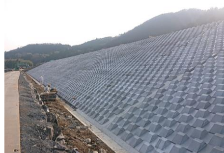
▲完成した護岸堤防