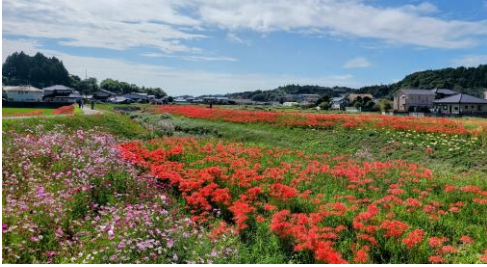
常陸太田市 源氏川沿川の彼岸花

編集・発行 国土交通省 常陸河川国道事務所 国土交通省 久慈川緊急治水対策河川事務所