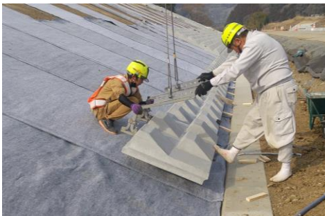
▲シートの上にブロックを置く様子

○コンクリートブロックと堤防や河岸の土の間には、フェルト素材のシートや塩化ビニール素材のシートを敷くんだよ。フェルト素材のシートは、堤防や河岸の土が洪水によって吸い出されるのを防ぐ役割、塩化ビニール素材のシートは、堤防に河川水や雨水が浸透するのを防ぐ役割をもっているよ。