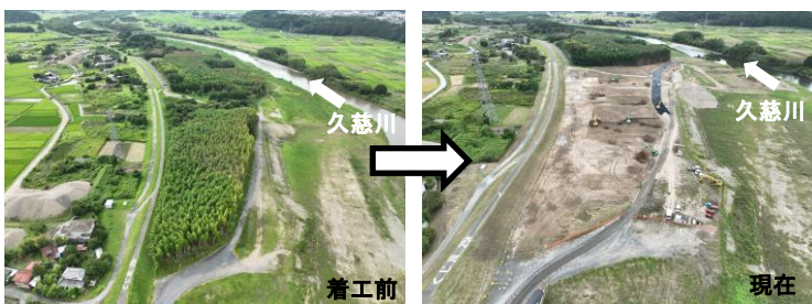
常陸大宮市宇留野地先/久慈川左岸24.0k付近