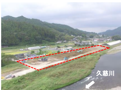
R4久慈川右岸舟生地先排水樋管改築外工事/樋口土木(株)

常陸大宮市舟生地先/久慈川右岸39.0k付近 堤防整備のため盛土を行っています。今後は護岸ブロックを施工していきます。