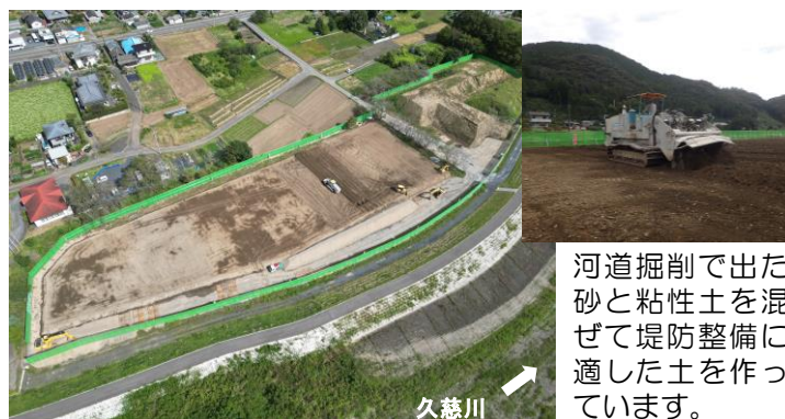
常陸大宮市家和楽地先/久慈川41.0k付近