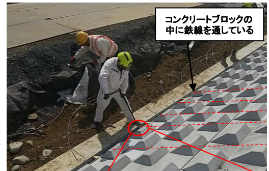
▼コンクリートブロック鉄線連結作業

○コンクリートブロックと堤防や河岸の土の間には、フェルト素材のシートや塩化ビニール素材のシートを敷くんだよ。フェルト素材のシートは、堤防や河岸の土が洪水によって吸い出されるのを防ぐ役割、塩化ビニール素材のシートは、堤防に河川水や雨水が浸透するのを防ぐ役割をもっているよ。