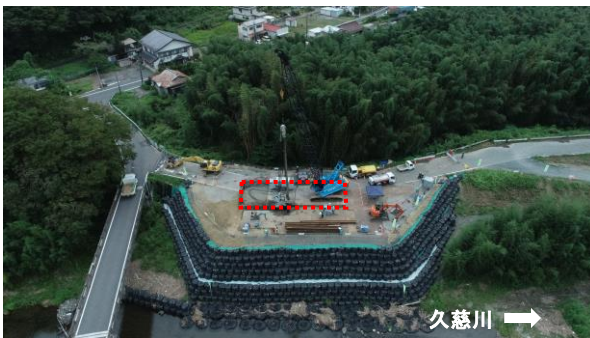
大子町袋田地先/久慈川左岸59.0k付近

左岸側の橋台施工のため鋼矢板を打設しました。今後、本格的に橋台施工に着手していきます。引き続き安全第一で工事を進めてまいります。