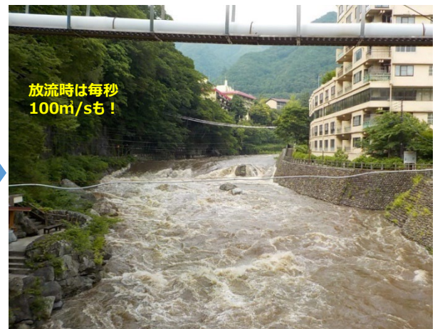
川治温泉街（薬師橋付近）