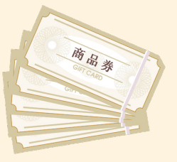
※イラストはイメージ