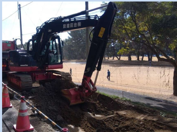
基礎コンクリート打設を行っています。 (令和6年1月)