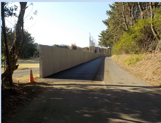
工事が完了しました。 (令和6年3月)