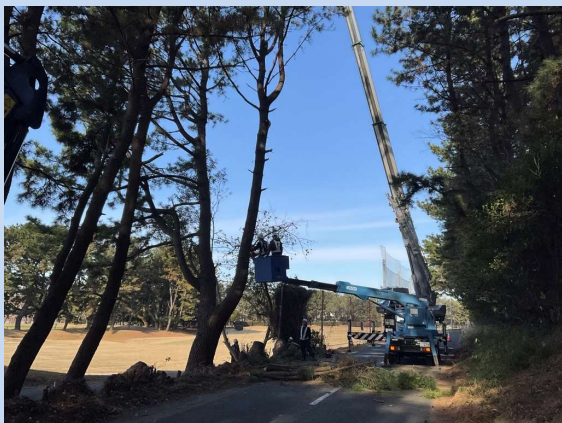
樹木を伐採しています。 (令和5年12月)