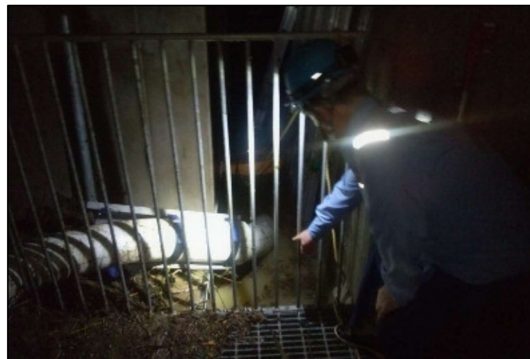
排水ポンプ車排水の状況(日立市役所地下駐車場)