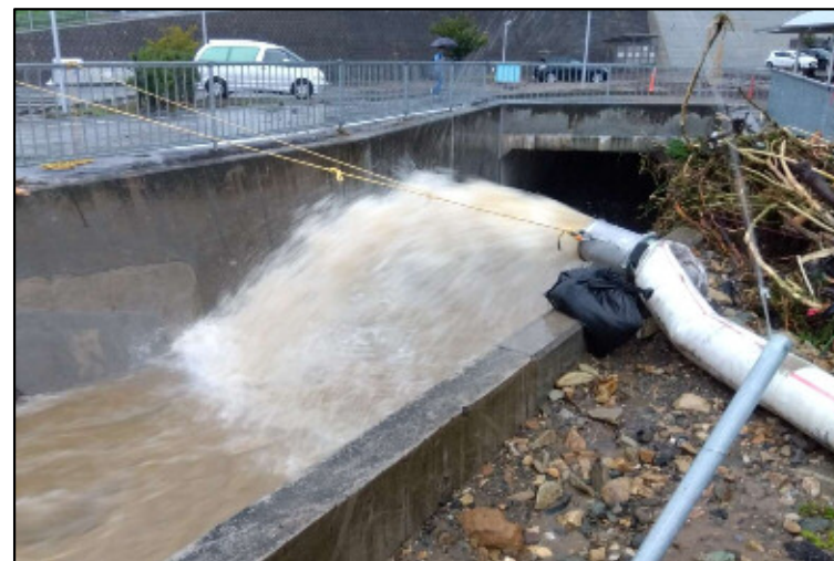
排水ポンプ車排水の状況(日立市役所)