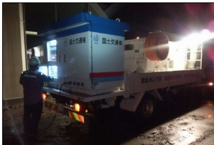
排水ポンプ車配置の状況(日立市役所)