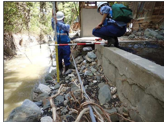
被災状況調査（日立市宮田町地先）