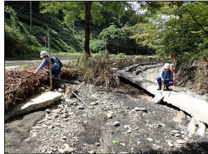
被災状況調査（日立市宮田町地先）