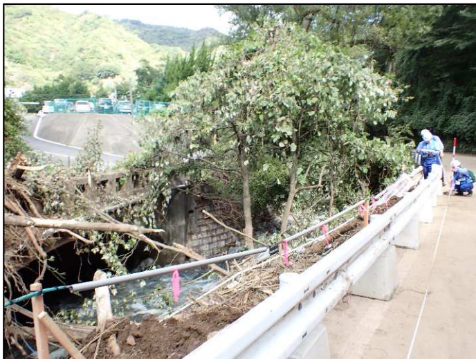
被災状況調査（日立市宮田町地先）