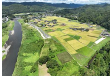
常陸大宮市西野内地区