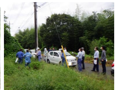
▲電柱立会状況(大子町頃藤南右岸)