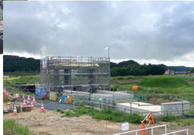
▲樋管全景(川裏側より撮影)

久慈川増水時に、逆流を防ぐための樋管を施工しています。 ※常陸河川国道事務所発注工事