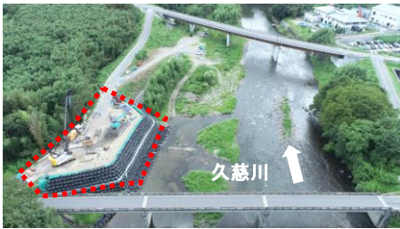
大子町袋田地先 / 久慈川左岸59.0k付近

左岸側の橋台を支える杭を6本施工しました。引き続き橋台本体工を施工していきます。