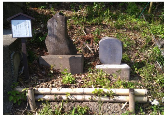
▲可恐石碑(大子町久野瀬・諏訪神社入口)

https://www.gsi.go.jp/bousaichiri/denshouhi.html