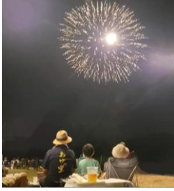
第40回あゆの里まつり(常陸大宮市)

編集・発行 国土交通省 常陸河川国道事務所 国土交通省 久慈川緊急治水対策河川事務所