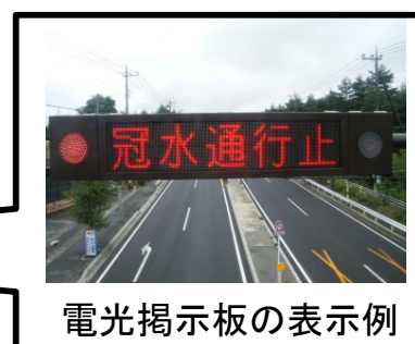
電光掲示板の表示例