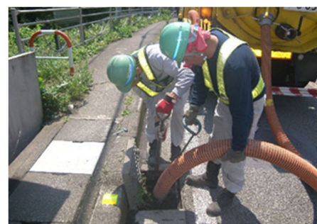
④道路排水柵の清掃