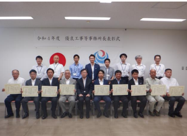
令和4年度 優良工事等事務所長表彰式

※優良工事として(株)瀧工務店が、優良業務として三井共同建設コンサルタント(株)、(株)オリエンタルコンサルタンツ、中央コンサルタンツ(株)、(株)地圏総合コンサルタント、(株)大輝が関東地方整備局長表彰を受賞しています。