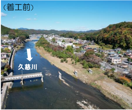
大子町大子地先 /久慈川左岸62.6k付近