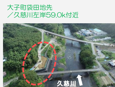
大子町袋田地先 /久慈川左岸59.0k付近