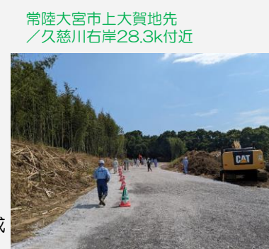
常陸大宮市上大賀地先 /久慈川右岸28.3k付近