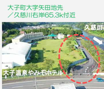
大子町大字矢田地先 /久慈川右岸65.3k付近