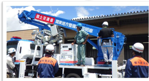
照明車操作の様子