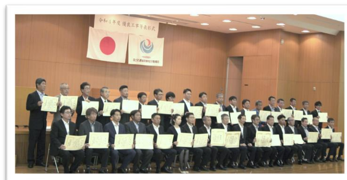
事務所長表彰受賞者