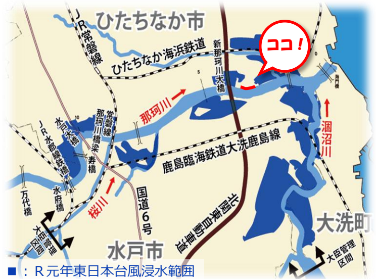
■ : R元年東日本台風浸水範囲

○洪水による被害を防ぎ命や財産を守るため、盛土により堤防を新設する工事を行います。