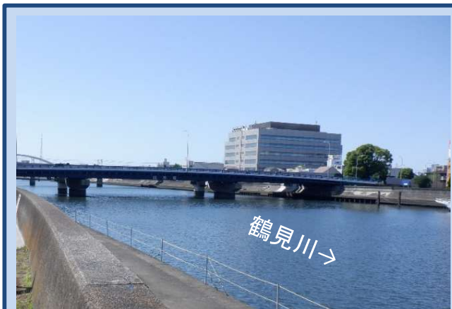
工事着手前 (令和5年7月)