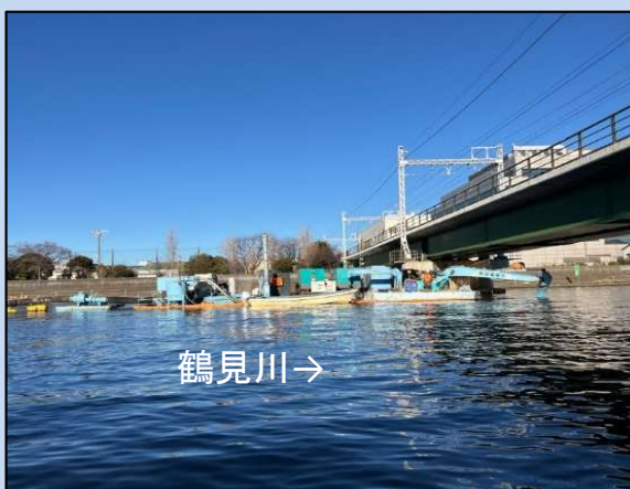
河道を浚渫しています。 (令和6年1月)