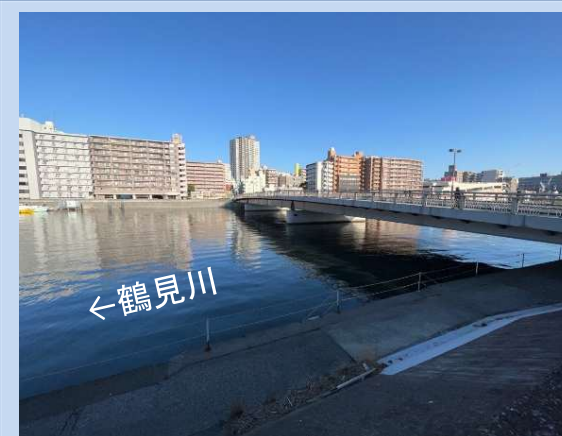
工事が完了しました。 (令和6年3月)