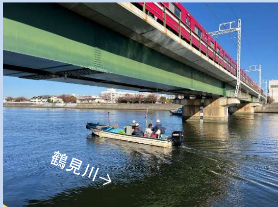
工事に入る準備をしています。 (令和5年12月)