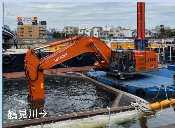
河道を浚渫しています。