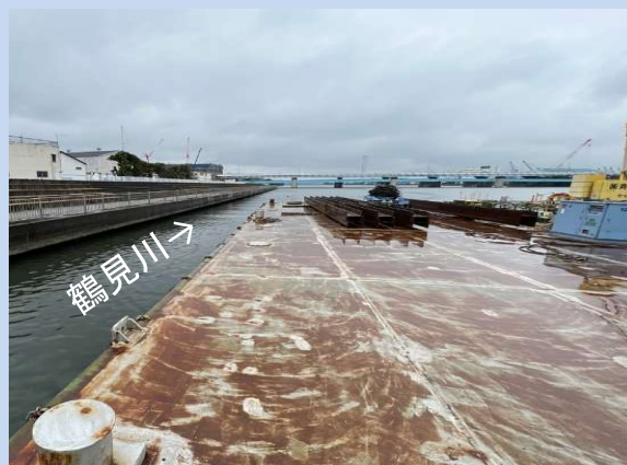
浚渫船の係留施設を撤去しています。 (令和6年2月)