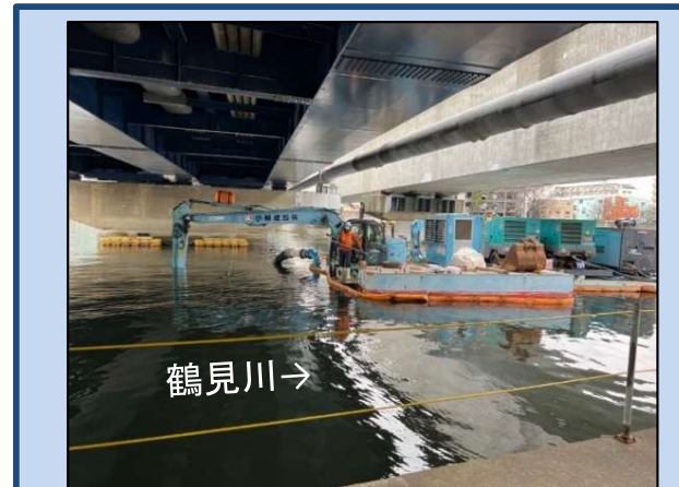
河道を浚渫しています。 (令和5年12月)