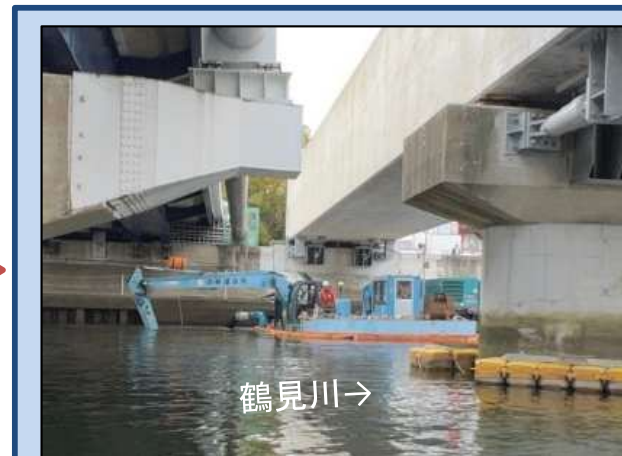
河道を浚渫しています。 (令和5年11月)