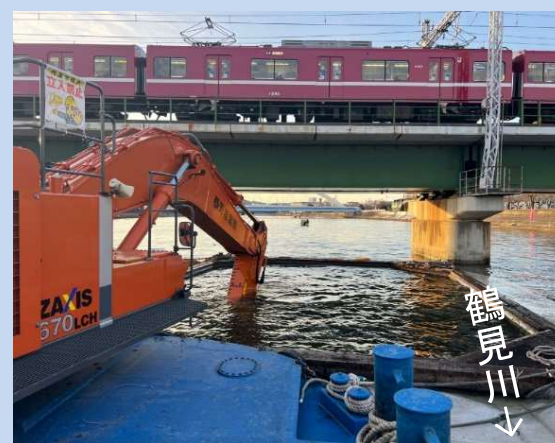
河道を浚渫しています。 (令和6年2月)