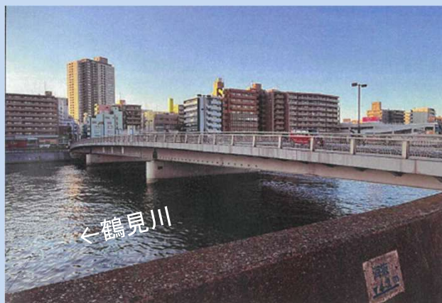
工事着手前 (令和5年7月)