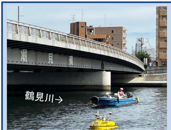
工事に入る準備をしています。 (令和5年10月)