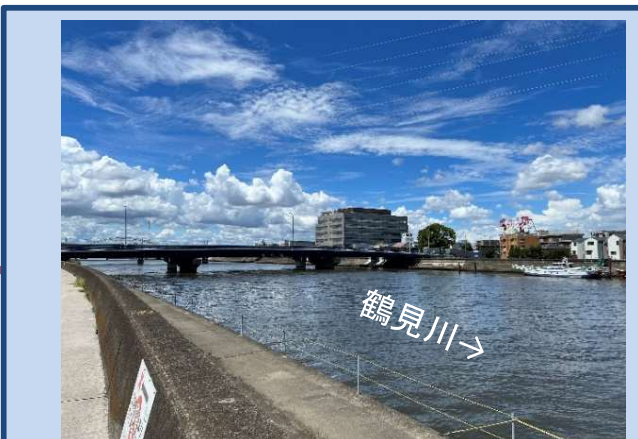
工事に入る準備をしています。 (令和5年10月)