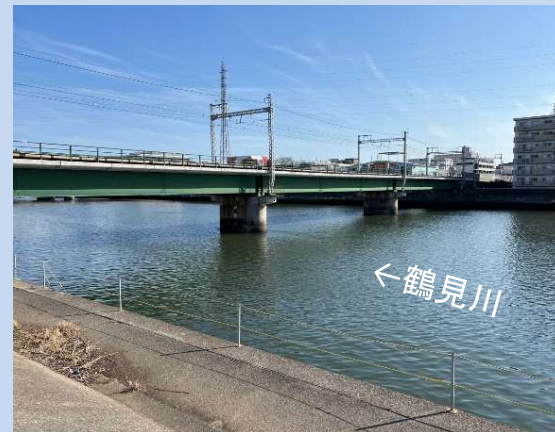
工事が完了しました。 (令和6年3月)