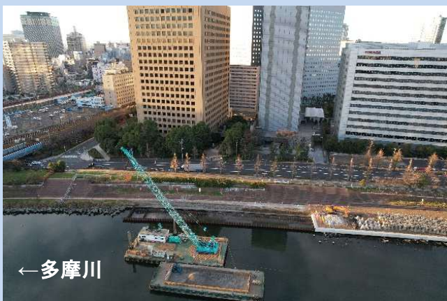
護岸を整備しています。 (令和5年12月)