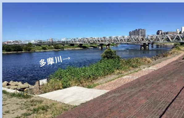
工事着手前 (令和5年9月)