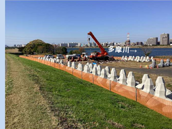
根固めブロックを製作しています。 (令和5年11月)