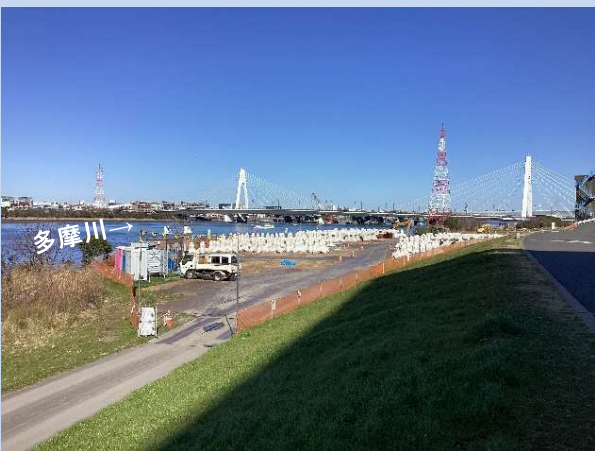
根固めブロックを運搬しています。 (令和6年2月)