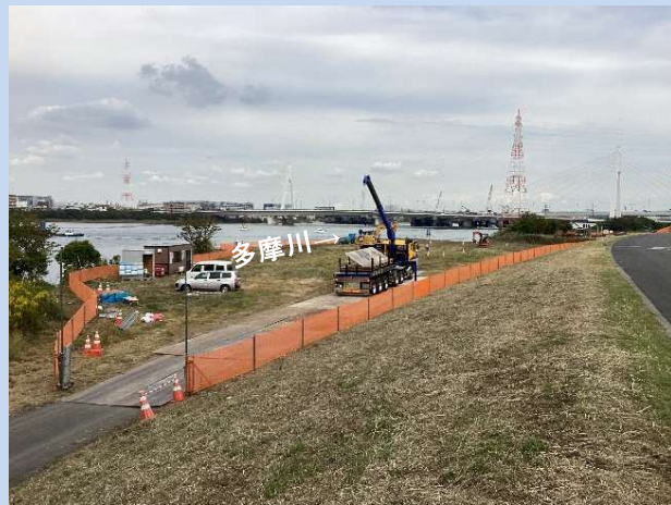
工事に入る準備をしています。 (令和5年10月)