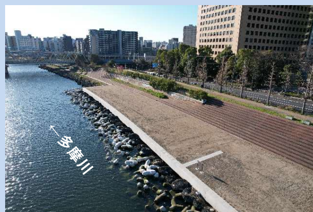
工事が完了しました。 (令和6年3月)