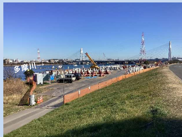
根固めブロックを製作しています。 (令和6年1月)