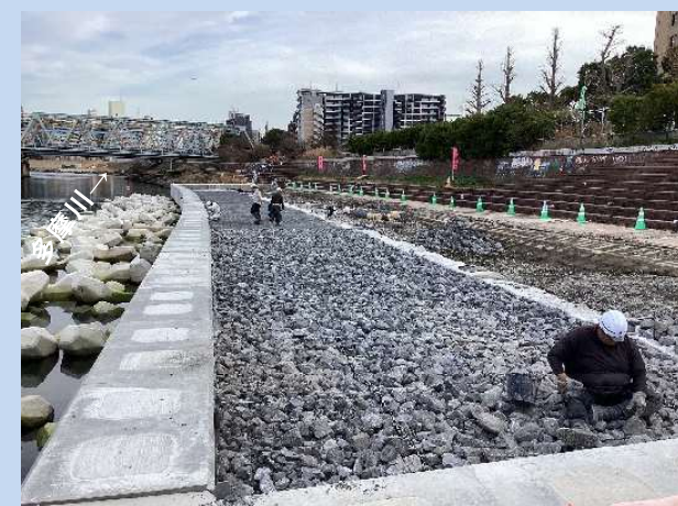
かごマットを設置しています。 (令和6年2月)