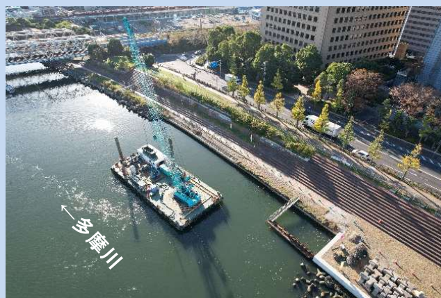
護岸を整備しています。 (令和5年11月)