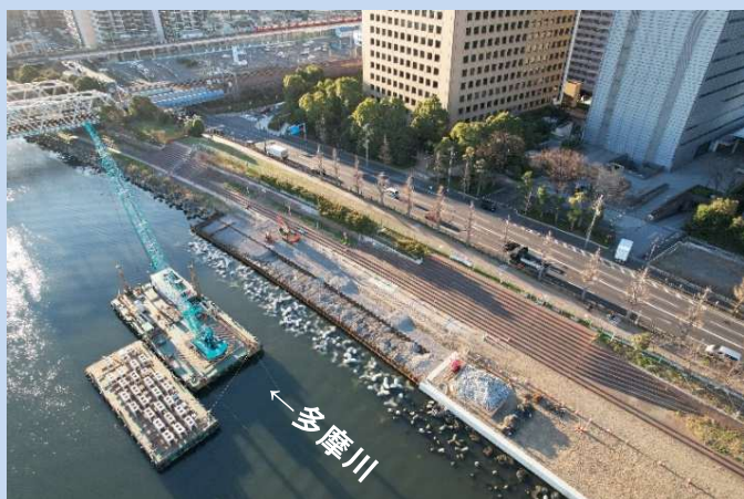
笠コンクリートブロックを設置しています。 (令和6年1月)