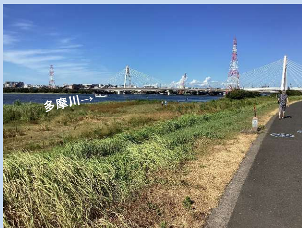
工事着手前 (令和5年9月)