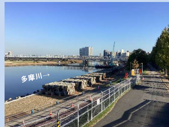
根固めブロックを撤去しています。 (令和5年11月)