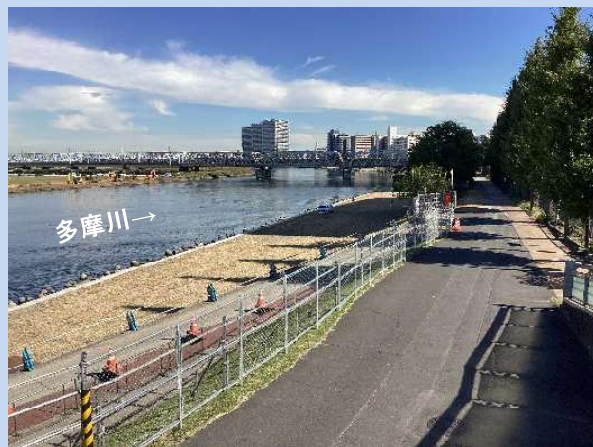
工事に入る準備をしています。 (令和5年10月)