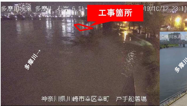
令和元年東日本台風の状況