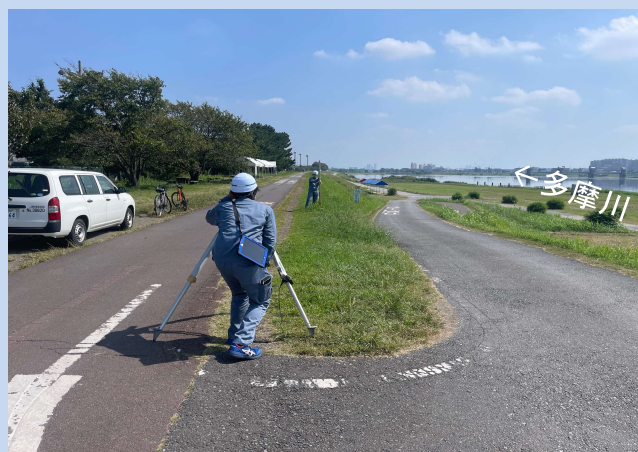
工事に入る準備をしています。 (令和5年10月)