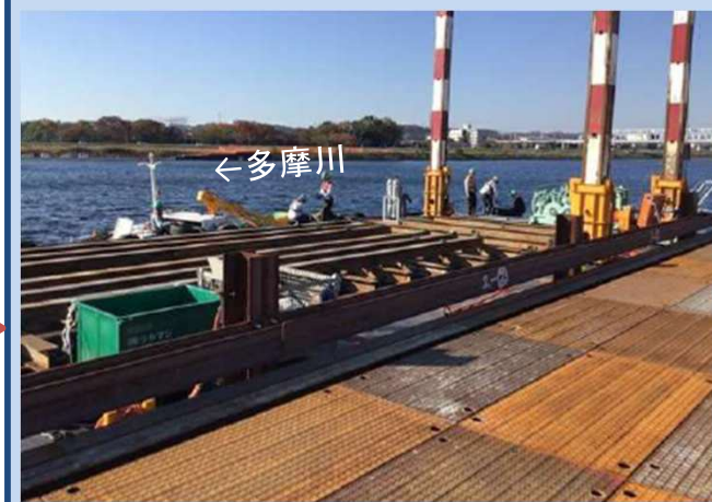
浚渫船の組立てをしています。 (令和5年11月)