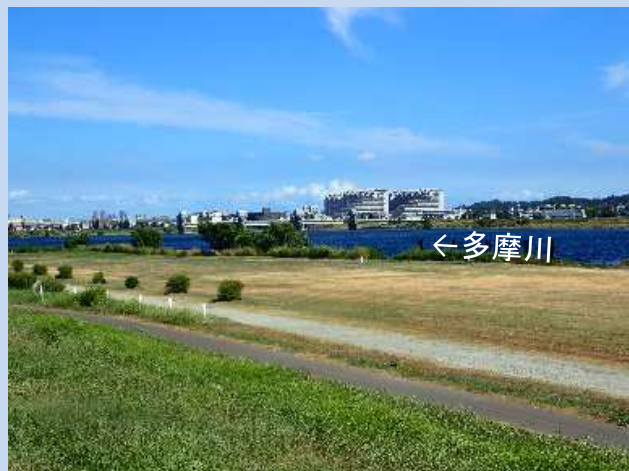
工事着手前 (令和5年7月)