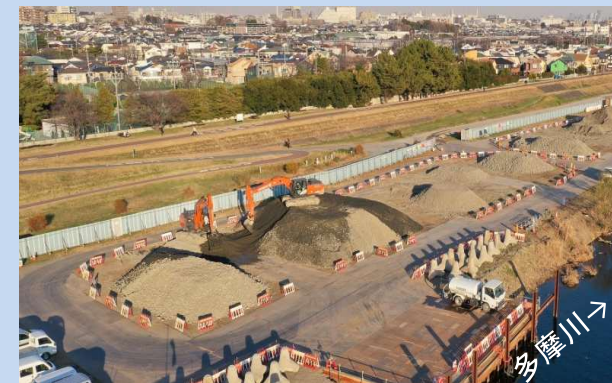
土砂のふるいわけをしています。