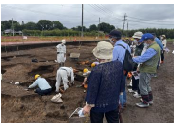
▲現地説明会の様子

常陸大宮市高渡地区の堤防整備箇所が埋蔵文化財の包蔵地であるため、公益財団法人茨城県教育財団に委託し発掘調査が実施されていましたが、6月に調査が完了し、6月12日には高渡地区の皆さまに調査成果の現地説明会が行われました。 高渡館跡の発掘調査では、平安時代の住居跡や室町時代の堀跡などを確認し、多くの遺物が出土しました。説明会には地域住民約30名が参加し、担当者の解説を興味深く聞いていました。