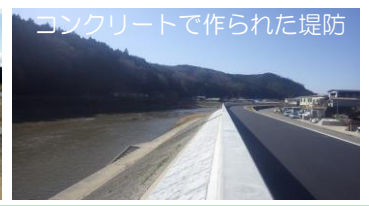
コンクリートで作られた堤防