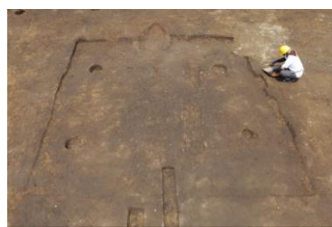
▲平安時代の住居跡