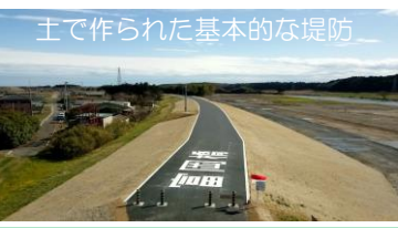
土で作られた基本的な堤防

地域のみなさまも近くに行ったら安全な場所から堤防をつくる様子を見学してみてください。