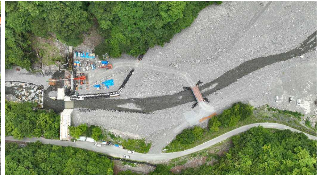
上空より本堰堤上流側を望む （砂防仮締切工、仮橋仮栈橋工）

既設空谷砂防堰堤に嵩上げ及びアンカー工を設置し、改築する工事。前年度から継続施工し、洪水・土砂氾濫被害を防止・軽減する。現在、アンカー工を実施中。