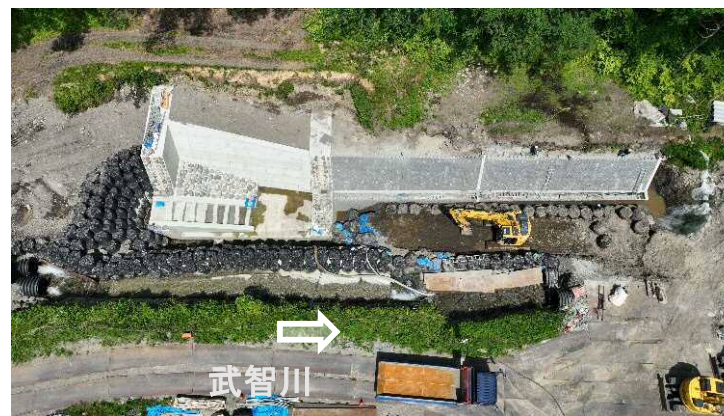
↑ 上空より施工箇所（第11床固工、流路護岸工）を望む

武智川下流床固群のうち、床固工、帯工及び護岸を施工し、土砂・洪水を安全に流下させ、土砂災害を防止する工事。現在、流路護岸工を実施中。