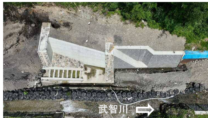
↑ 上空より施工箇所（第10床固工、流路護岸工）を望む