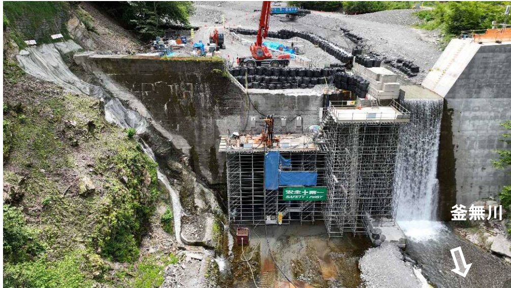
下流より本堰堤を望む（コンクリート堰堤工 アンカー工）