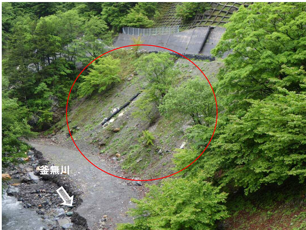
下流より「施工箇所を望む （I地区：中島砂防堰堤下流）」