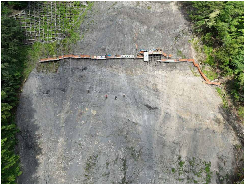
上空より施工箇所を望む