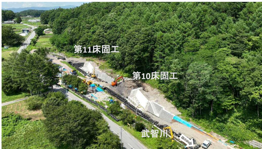
下流上空より施工箇所を望む