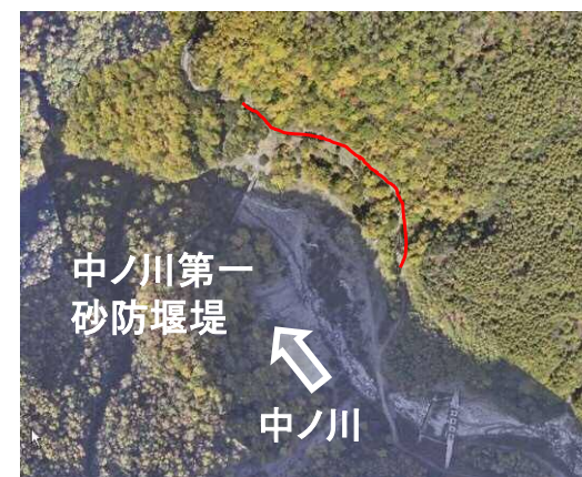
↑上空より施工箇所を望む（中ノ川地区）」

令和元年10月の台風による出水で被災した釜無川工事用道路の補修等及び中ノ川工事用道路において、コンクリート舗装工を実施する工事。7月末よりI地区の仮設工（工事用道路）に着手。