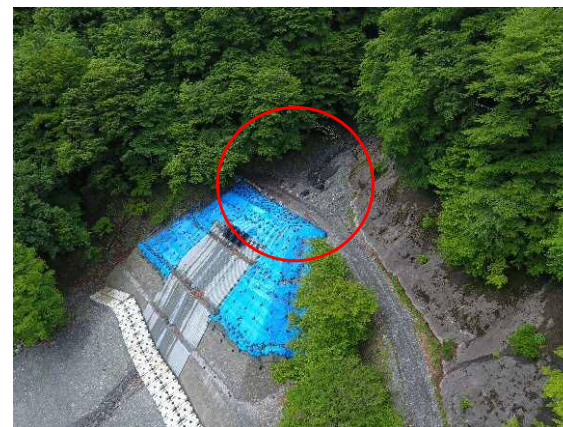
↑上空より施工箇所を望む （J地区：中島砂防堰堤上流）」