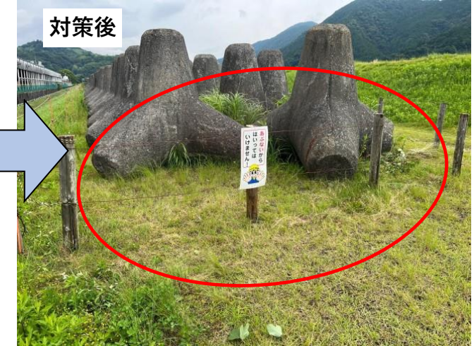
看板、杭の補修を実施