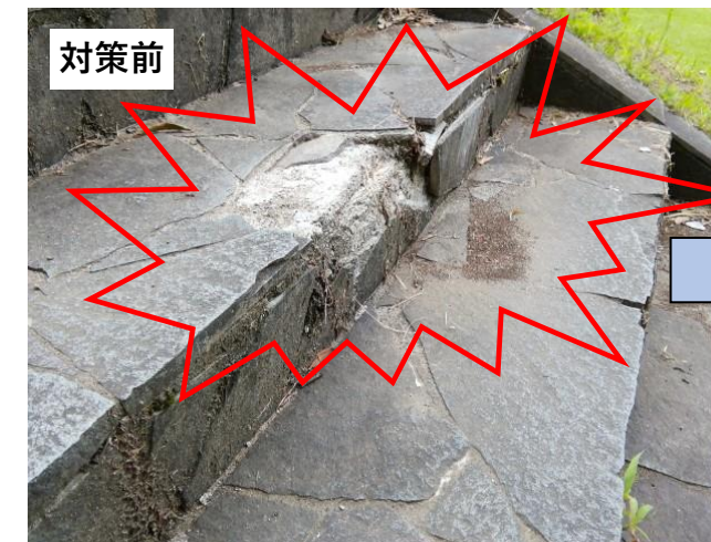
ステップ部が剥離している