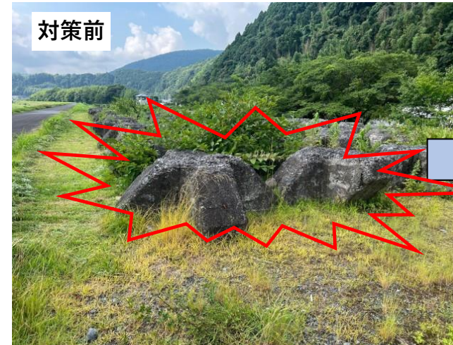
根固めブロックの視認性が低下している