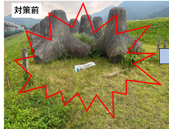
看板、杭が倒れている