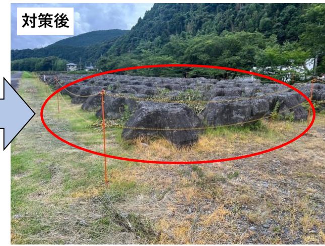
立ち入り禁止ロープの設置