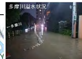
東京都世田谷区玉川地区の溢水による浸水被害状況