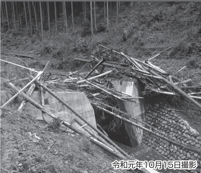
令和元年10月15日撮影