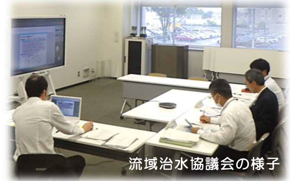
流域治水協議会の様子