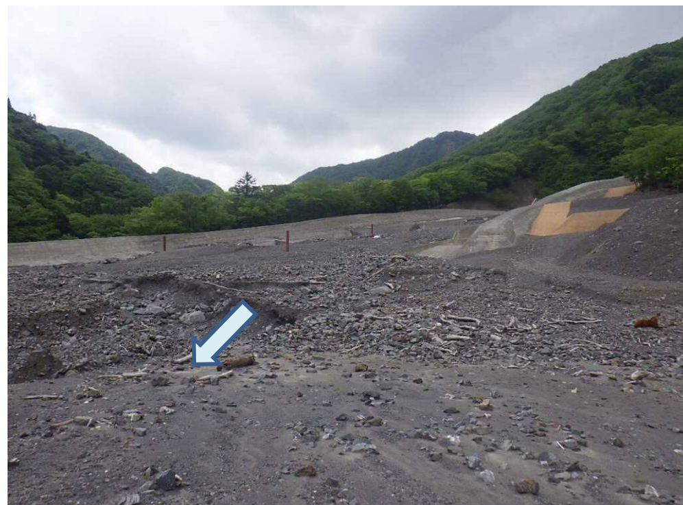
大春木工区 下流側より望む

本工事は、早川右支の春木川筋に設置されている既設の仲島砂防堰堤について、流木災害を防止するために、流木捕捉工を設置する工事 及び早川右支川の春木川筋における既設の大春木床固群について、流路機能を維持向上させるため、改築を実施する工事です。 現在準備中