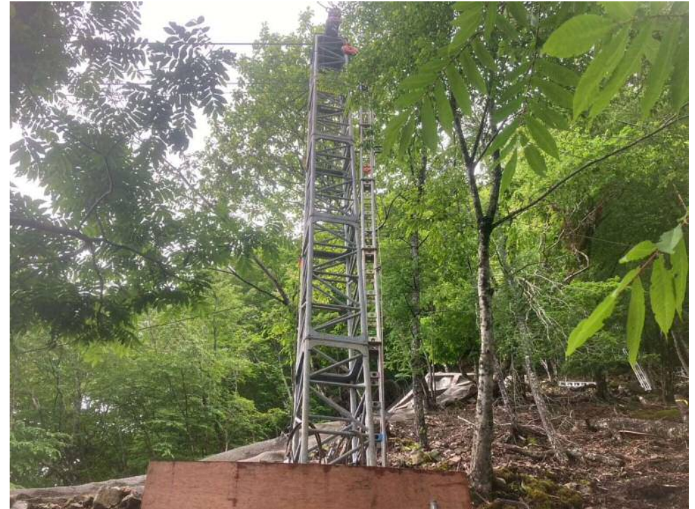
ケーブルクレーン設置施工中

早川右支川の春木川左岸の斜面において、崩壊の抑制・拡大防止を目的として山腹工を施工する工事行っています。 現在ケーブルクレーン設置施工中。