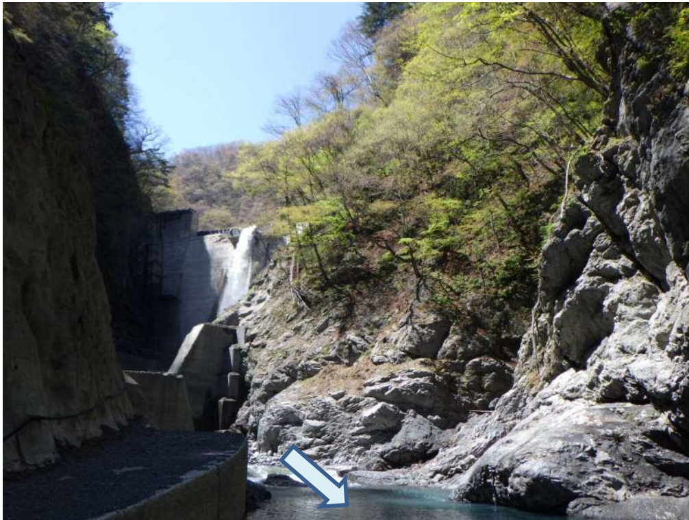
下流より施工箇所を望む