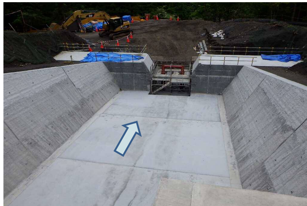
上流側より側壁及び堰堤施工箇所を望む

早川左支塩島沢において、土砂災害防止を目的とした砂防堰堤と側壁を設置する工事を行っています。