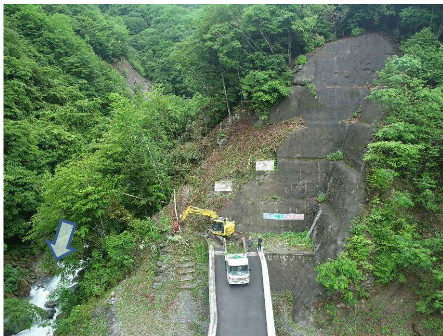
【下流側上空より施工箇所を望む】