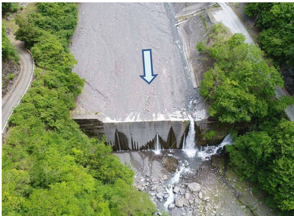
仲島工区 下流側上空より望む