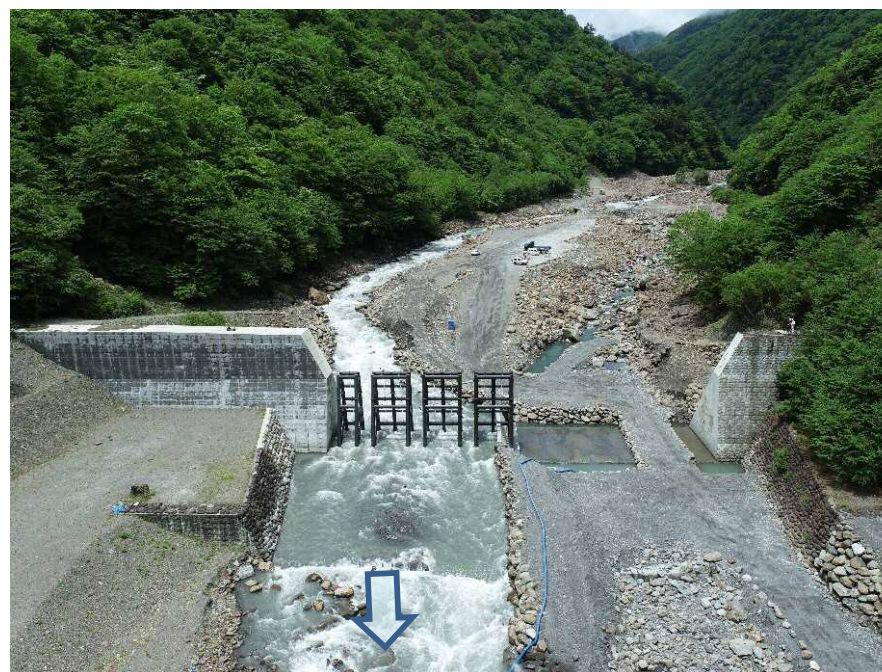
【下流側上空より施工箇所を望む】

既設の砂防堰堤を鋼製透過型砂防堰堤に改築し、土砂捕捉機能の向上と流木災害を防止するための工事を行っています。 仮締め切りの設置が完了し、土工事を開始しました。