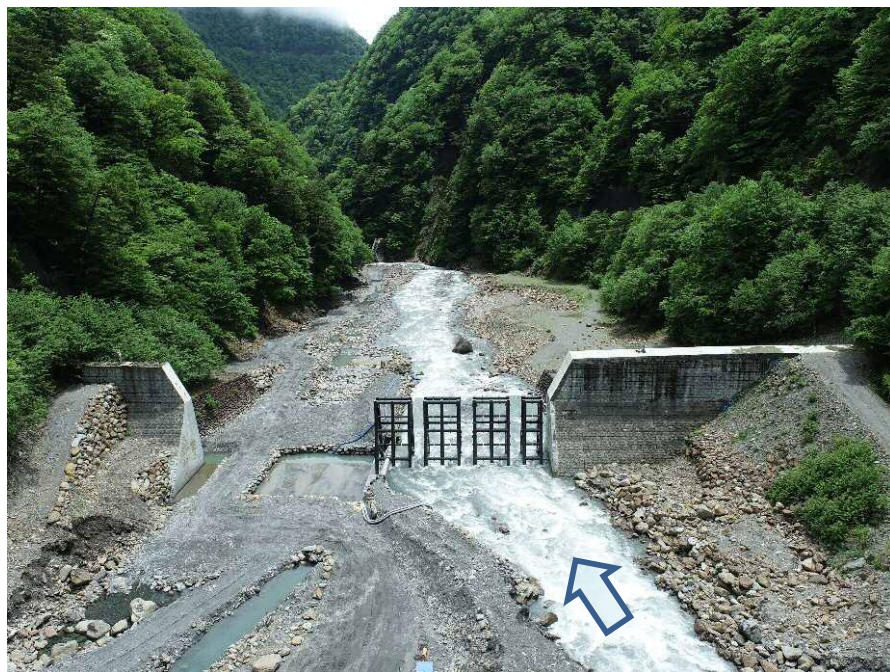
【上流側上空より施工箇所を望む】