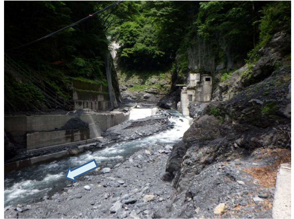
下流より施工箇所を望む

稲又第三砂防堰堤の改築工事を行うための仮排水路を造る工事です。 現在起工測量他準備中。