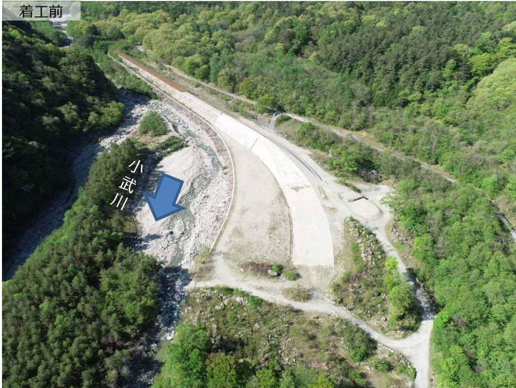
下流側より上流撮影