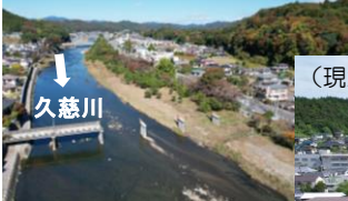
大子町大子地先 ／久慈川左岸62.6k付近