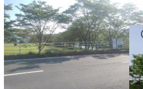
大子町矢田地先 ／久慈川右岸65.1k付近

堤防の整備に向けて、 「大子温泉やみぞホテル」様にご協力頂き、 工事用道路の整備を 行っています。