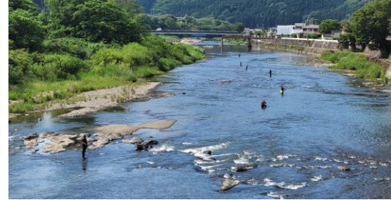
池田橋から下流架替え工事中の松沼橋を望む

○6月1日に久慈川の鮎釣りが解禁になりました。 ○出水期に入りますが、安全第一で引き続き工事を行います。ご理解・ご協力をお願いします。