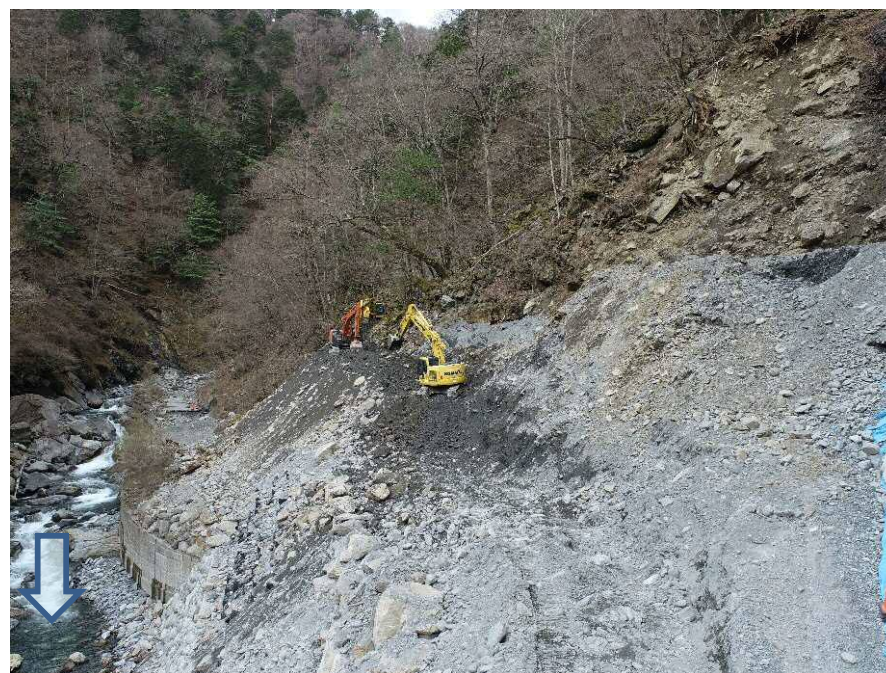
【下流側より施工箇所を望む】

早川右支荒川に、砂防堰堤を整備するための工事用道路を設置する工事を行っています。工事用仮設搬入路の設置と土工事(掘削工)を実施中です。