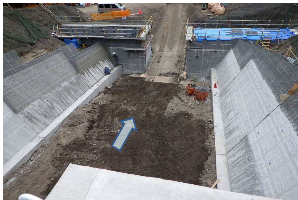
上流側より側壁及び堰堤施工箇所を望む

早川左支塩島沢において、土砂災害防止を目的とした砂防堰堤と側壁を設置する工事を行っています。