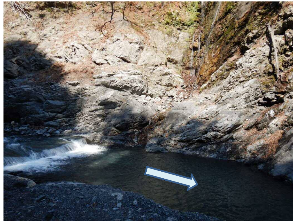
水叩き施工箇所付近

稲又第三砂防堰堤の改築工事を行うための仮排水路を造る工事です。 現在設計照査及び準備中。