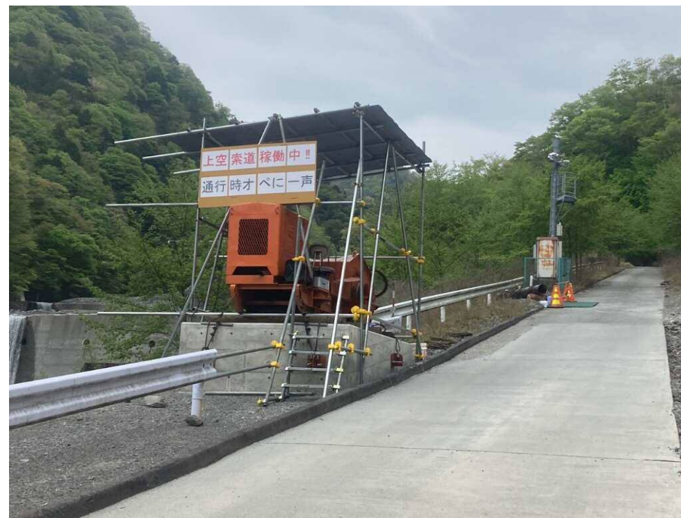
ケーブルクレーン設置施工中

早川右支川の春木川左岸の斜面において、崩壊の抑制・拡大防止を目的として山腹工を施工する工事行っています。 現在ケーブルクレーン設置施工中。