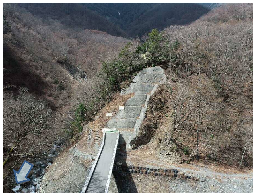
【下流側上空より施工箇所を望む】

継続中であった砂防堰堤の整備と、上流域の砂防堰堤を整備するための、工事用道路を設置する工事を行っています。 現場の施工を開始しました。現在、仮設工を実施しています。