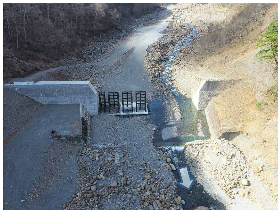
【下流側上空より施工箇所を望む】

既設の砂防堰堤を鋼製透過型砂防堰堤に改築し、土砂捕捉機能の向上と流木災害を防止するための工事を行っています。 現場の施工を開始しました。現在、仮設工を実施しています。