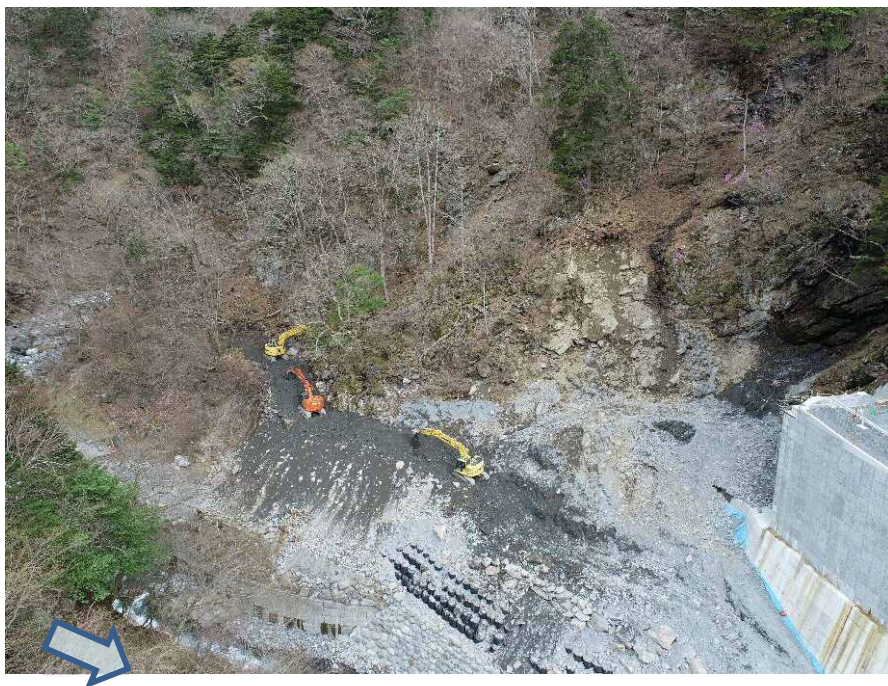
【右岸側上空より施工箇所を望む】