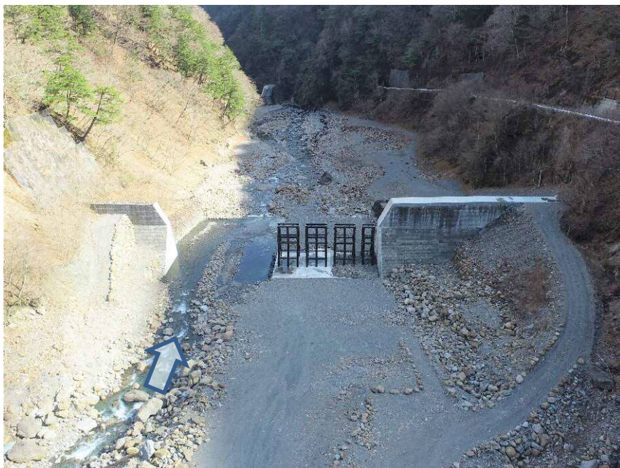
【上流側上空より施工箇所を望む】