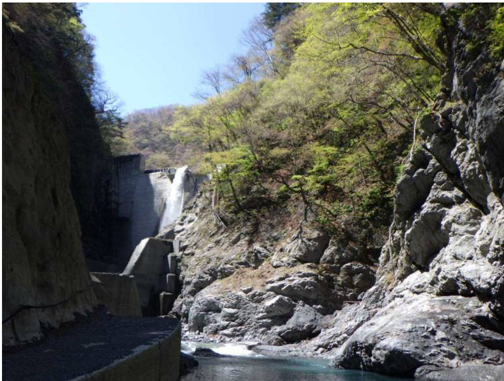
下流より施工箇所を望む