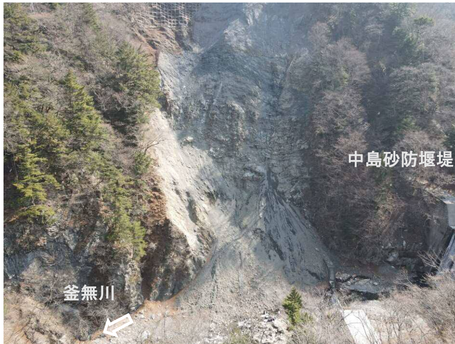
上空より施工箇所（全景）を望む