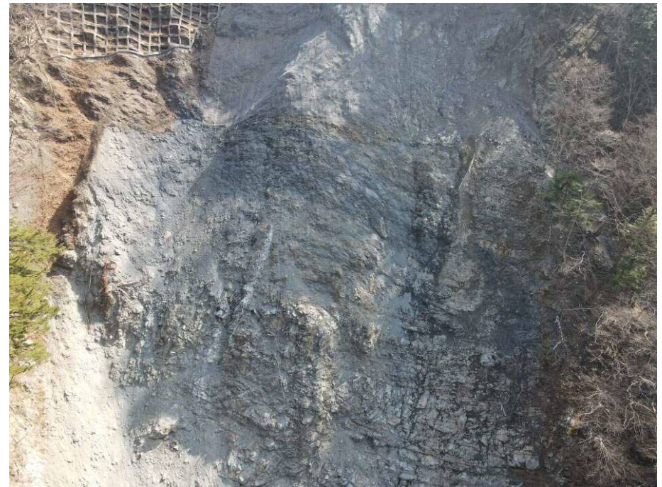
上空より施工箇所（近景）を望む

中島砂防堰堤の改築にあたり、支障となる右岸崩壊地からの落石対策を行う斜面对策工事。前年度工事から継続。現在、工事用道路、作業ヤード整備などの仮設工を実施中。