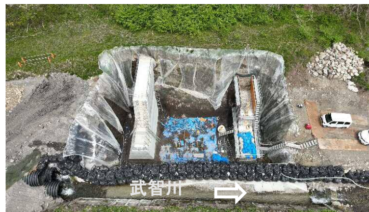
↑ 上空より施工箇所（第11床固工）を望む

武智川下流床固群のうち、床固工、帯工及び護岸を施工し、土砂・洪水を安全に流下させ、土砂災害を防止する工事。現在、床固工（本堤、副堤、側壁）と流路護岸工を実施中。