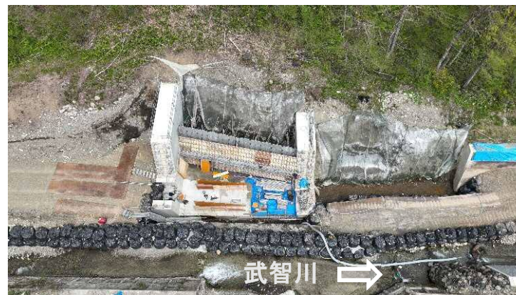
↑ 上空より施工箇所（第10床固工、流路護岸工）を望む