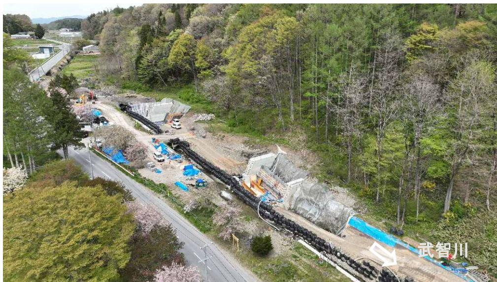
下流上空より施工箇所を望む