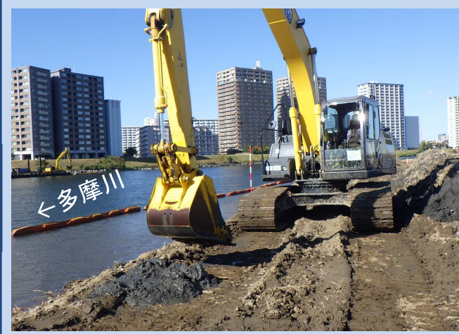
工事用道路の掘削をしています。 (令和5年11月)