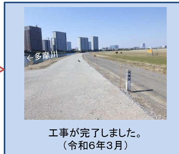
工事が完了しました。 (令和6年3月)