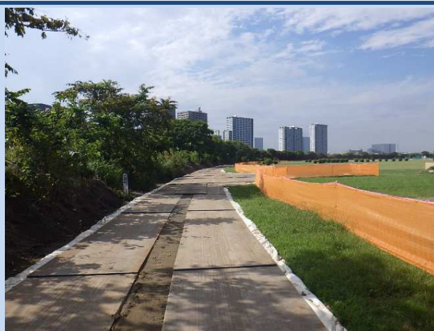
仮設工(鉄板敷設) (令和5年9月)