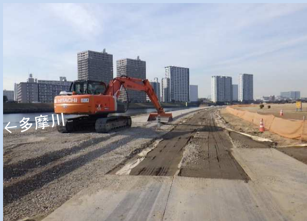
工事用道路の整備が完了しました。 (令和6年2月)