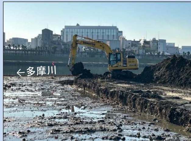
河道掘削を行っています。 (令和5年11月)