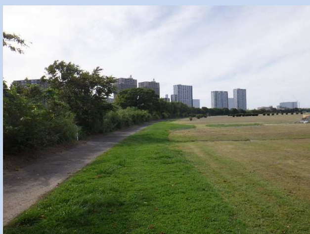
工事着手前 (令和5年9月)