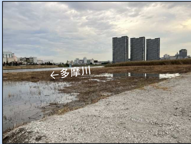
工事に入る準備をしています。 (令和5年10月)