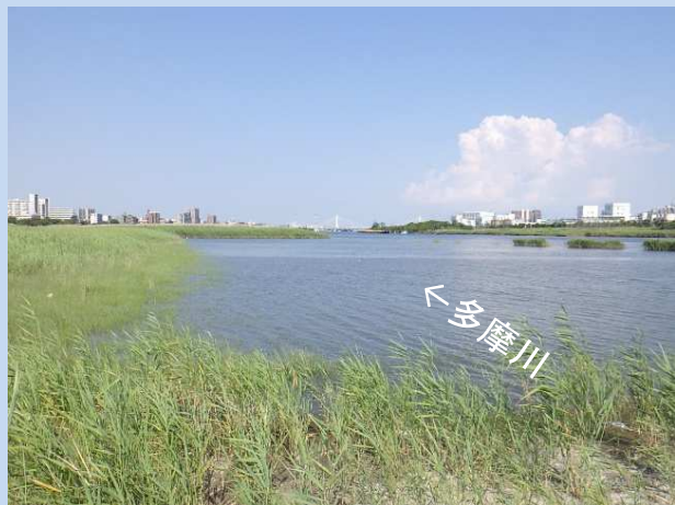
工事着手前 (令和5年7月)