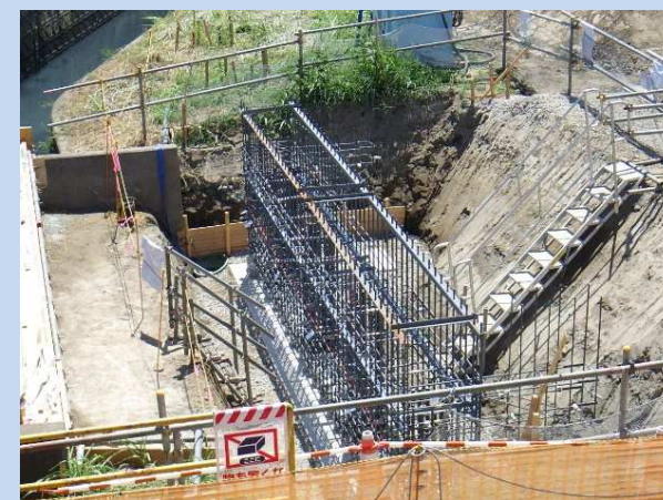
橋台鉄筋組立完了(下流側) (令和5年7月)