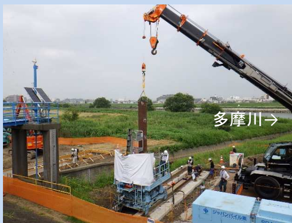
既製杭工 圧入状況(下流側) (令和5年6月)