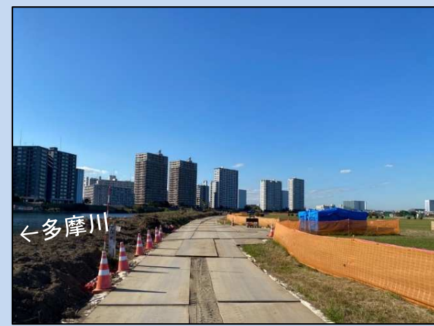
樹木伐採・不法投棄ゴミ回収 (令和5年10月)