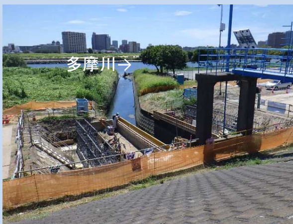
橋台鉄筋組立完了(上流側) (令和5年7月)