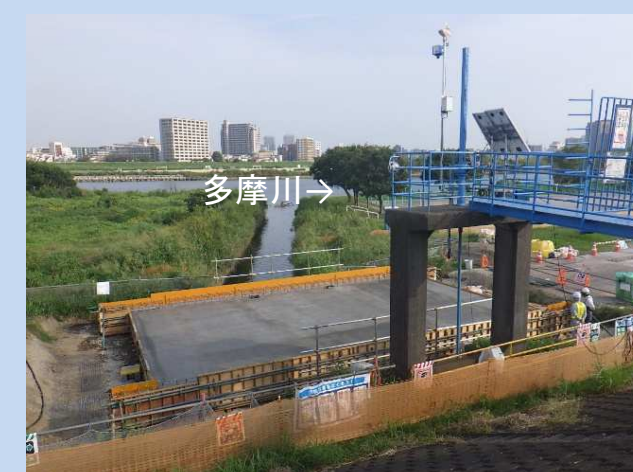
鋼橋上部工コンクリート打設完了 (令和5年9月)