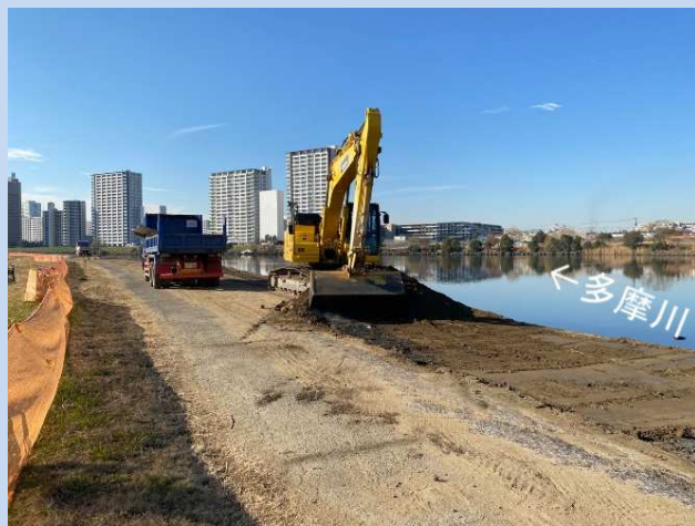
工事用道路の掘削をしています。 (令和5年12月)