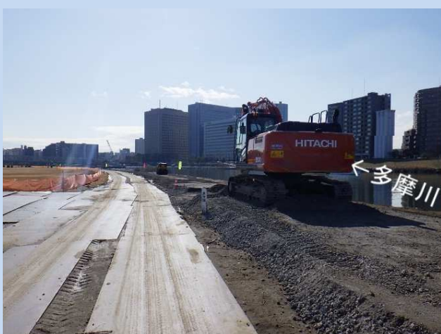
工事用道路の敷砂利をしています。 (令和6年1月)