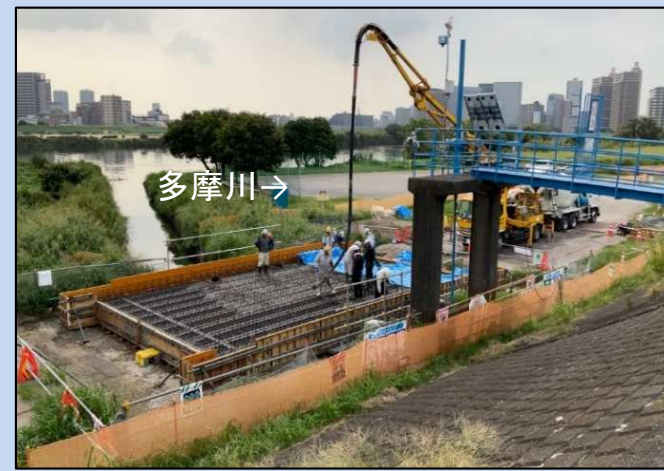
鋼橋上部工コンクリート打設状況 (令和5年9月)