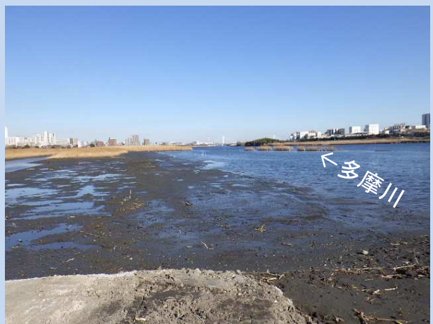
河道掘削が完了しました。 (令和6年1月)