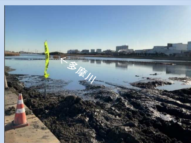
河道掘削を行っています。 (令和5年12月)