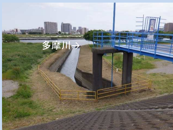
工事着手前 (令和5年4月)