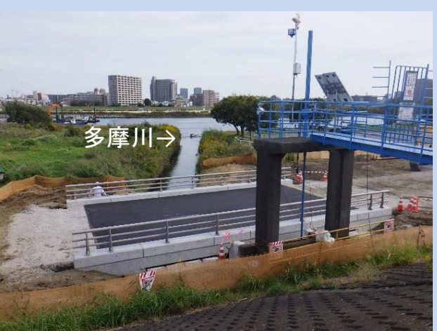
舗装完了 (令和5年10月)