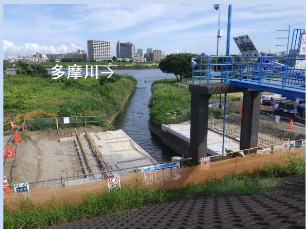
橋台埋め戻し完了 (令和5年8月)