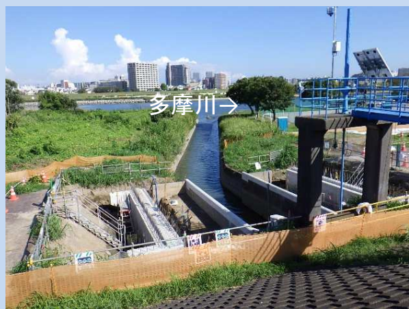
橋台コンクリート打設完了 (令和5年8月)