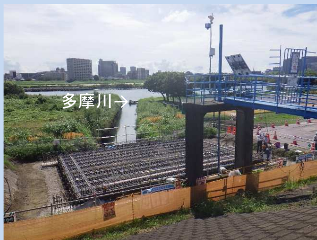
鋼橋上部工鉄筋組立完了 (令和5年9月)