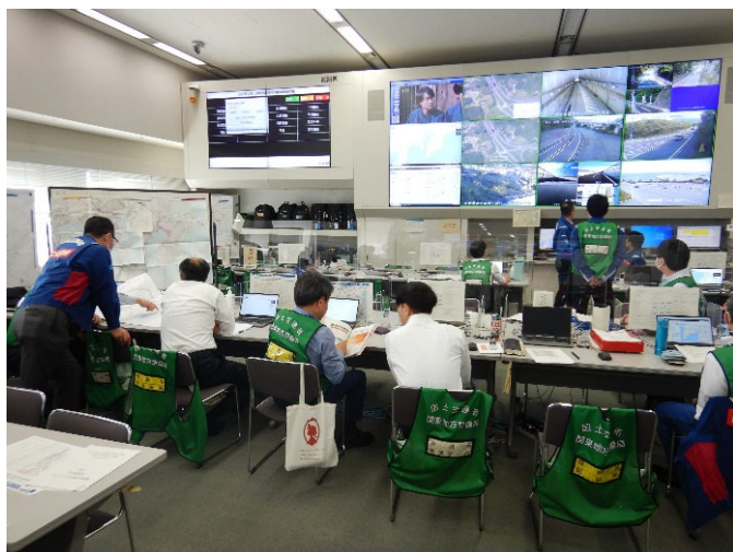
災害対策本部室の状況