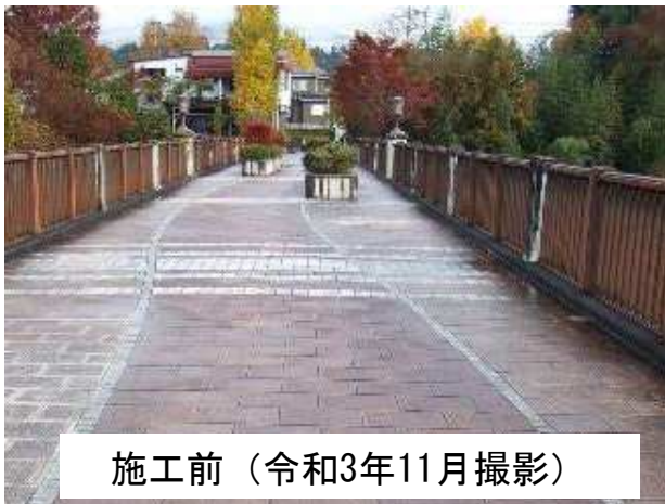
施工前（令和3年11月撮影）

令和3年10月から進めてきました 秩父橋の補修工事が完成しました 。 工事完成に伴い、秩父市へ3月29日に管理を引き渡しました。 なお、秩父市で花壇の植栽を行いました。 ご利用者の皆様、ご協力を頂き大変ありがとうございました。