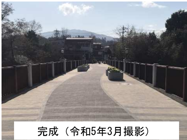
完成（令和5年3月撮影）