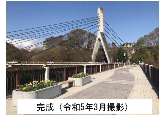
完成（令和5年3月撮影）