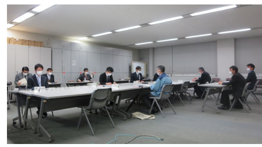
関東地方流域治水連絡会議との連絡・調整