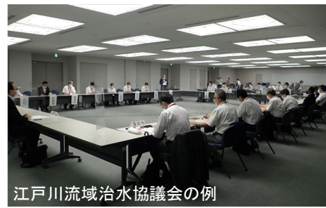
各流域治水協議会との連絡・調整