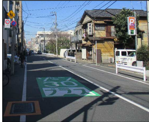
区域内写真（整備後）

区域内の規制開始に当たり、次の日時・場所で、警視庁及び墨田区が交通安全の啓発キャンペーンを実施します。