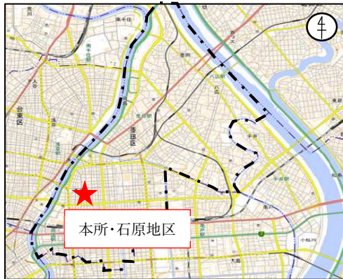
国土地理院の地理院地図に設定箇所等を追記して掲載